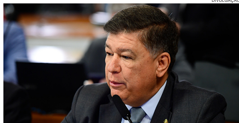
Senador Carlos Viana defende jornada com mais dias de descanso para servidores de áreas essenciais

Viana afirmou, no entanto, que uma eventual mudança precisaria ser implantada gradualmente. Para ele, estados