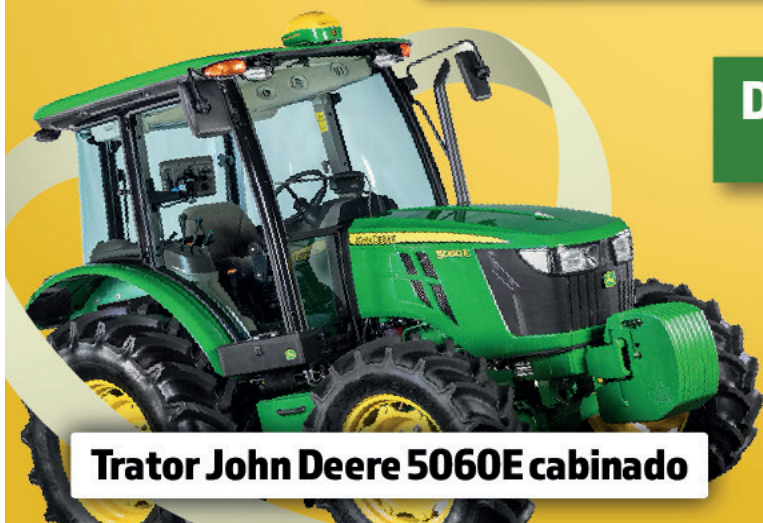
Trator John Deere 5060E cabinado

DOAÇÃO: R$2.000,00 com 25 chances de ganhar!