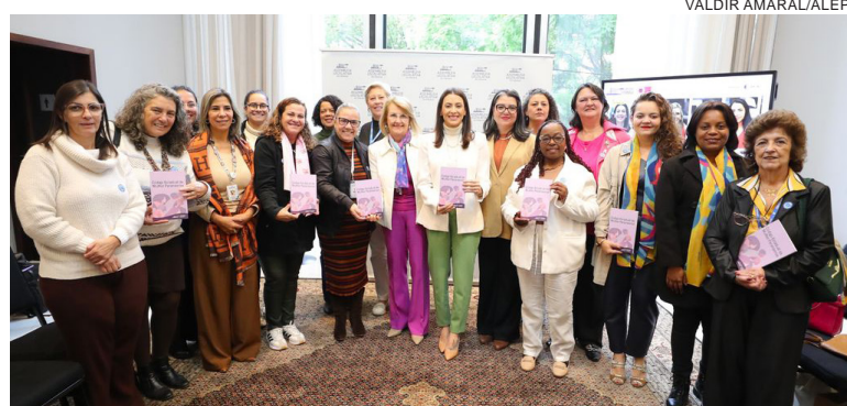
Parlamentares e conselheiras debateram ações para ampliar a participação feminina na política e enfrentar a violência de gênero no processo eleitoral