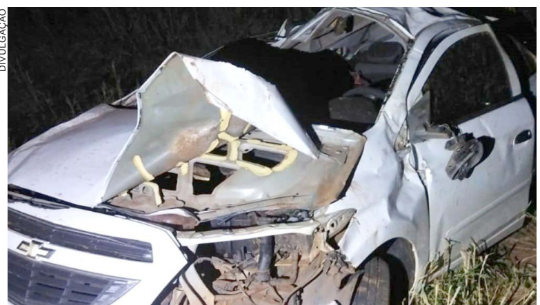
PRISMA no qual a enfermeira era passageira ficou completamente destruído. Mulher foi ejetada para fora do veículo e morreu no local. Motorista foi preso no hospital

Até o momento, a Polícia Civil não divulgou detalhes sobre a identidade da vítima do homicídio nem sobre possíveis suspeitos. As investigações continuam para esclarecer os dois casos e identificar os responsáveis.