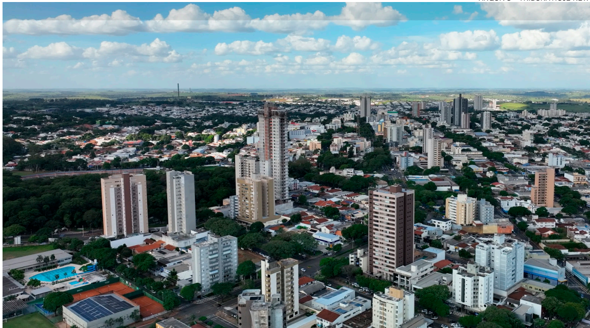
Umuarama está entre os 147 municípios paranaenses que receberão pesquisadores do Ipardes para o levantamento inédito sobre o perfil dos cuidadores de idosos no Paraná

prender quem são os cuidadores, quais as condições em que desempenham suas atividades, os desafios enfrentados no cotidiano e as necessidades de apoio existentes. O levantamento inclui tanto profissionais contratados quanto familiares que assumem os cuidados de idosos em situação de dependência.