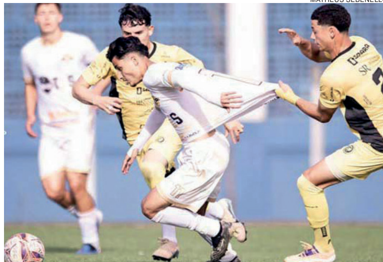
Cascavel e Araucária decidem vaga na final do Sub-20