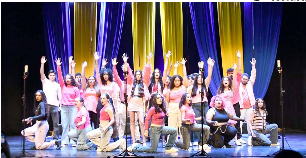
A PROPOSTA da administração é oferecer atividades para todas as faixas etárias e valorizar a participação da comunidade

Hoje (terça-feira, 9), a programação prossegue com a realização da 1ª Feira Especial do Programa Lixo que Vale. O evento acontece a partir das 13h30 no espaço da Feira do Produtor, localizado nos fundos do Estádio Municipal Lúcio Pipino. A iniciativa permite que moradores troquem materiais