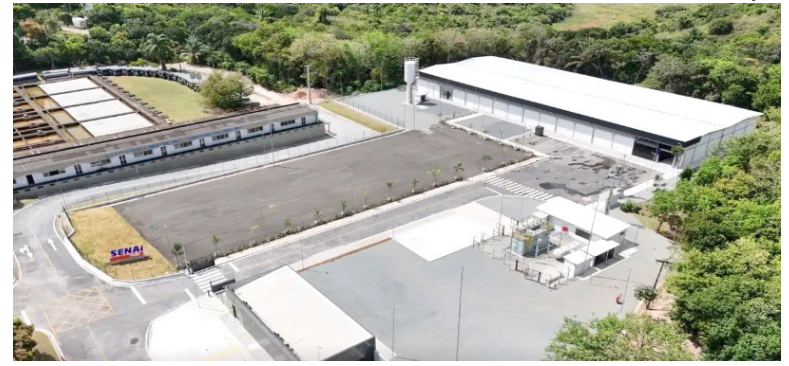
PROJETO liderado por instituições brasileiras busca ampliar a segurança viária, reduzir dependência tecnológica e fortalecer a indústria automotiva nacional

Além dos benefícios relacionados à segurança, o projeto possui forte impacto estratégico para o país. Atualmente, grande parte das tecnologias embarcadas em veículos modernos depende de componentes importados. Com a criação de uma