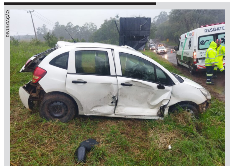
Um motorista ficou ferido em um acidente envolvendo um carro e duas carretas na tarde de domingo (14), na PR-323, em Umuarama. Segundo a Polícia Rodoviária Estadual, o condutor de um Citroën C3 tentou ultrapassar uma carreta, mas ao perceber outro caminhão vindo em sentido contrário, retornou à pista e atingiu lateralmente o veículo de carga. Após a colisão, o automóvel saiu da pista e bateu contra uma placa de sinalização. O motorista recebeu atendimento da concessionária EPR e foi encaminhado ao Hospital Cemil. As carretas tiveram apenas danos leves e não houve vítimas fatais.

atendimento médico, ele retornou à custódia policial. O caso foi encaminhado à Polícia Civil para investigação.