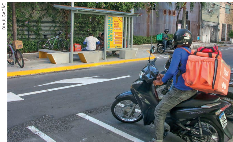
PROGRAMA Move Motos oferece juros abaixo do mercado