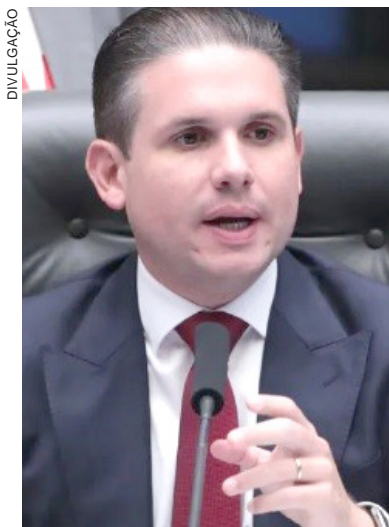
RELATÓRIOS das propostas serão debatidos por líderes partidários em reunião ainda hoje

O projeto sobre o fim da escala 6x1 tramita com urgência e está trancando a pauta da Casa. O plenário deve analisar a proposta na terça e, se for aprovada, destravar a agenda de votações do plenário. Isso