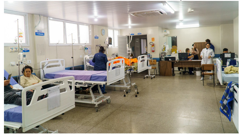
Auditoria avaliou serviços de saúde do município e apontou oportunidades para ampliar a eficiência e o atendimento à população

Para Umuarama, as recomendações representam uma oportunidade de avaliar procedimentos, aperfeiçoar