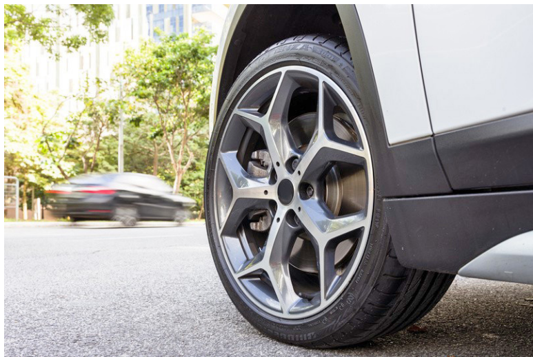
Os pneus devem ser calibrados semanalmente, sempre com os pneus frios, antes de rodar ou após pelo menos três horas com o veículo parado

É importante reforçar que economia de combustível não deve estar associada a improvisos, mas sim a boas práticas de manutenção e condução. “Pequenos cuidados fazem diferença no longo prazo. Manter os pneus calibrados corretamente, em bom estado e com a manutenção em dia contribui não só para reduzir o consumo, mas também para garantir mais segurança ao dirigir”, reforça Ayala.