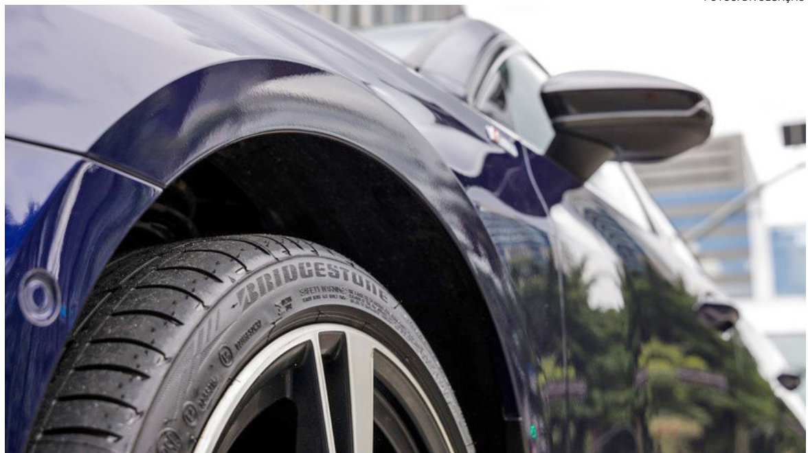
Manutenção correta evita desperdícios, melhora a eficiência do veículo e contribui para uma condução mais segura no dia a dia

Além da calibragem, outros fatores relacionados aos pneus