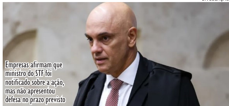
Empresas afirmam que ministro do STF foi notificado sobre a ação, mas não apresentou defesa no prazo previsto