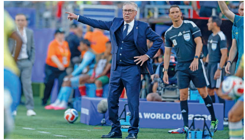
Ancelotti tem pressão por vitória para seguir vivo na Copa