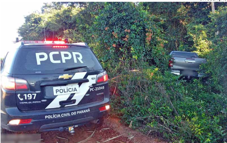
O VEÍCULO foi encontrado abandonado às margens de um canal, em um matagal, na estrada de acesso ao distrito de Serra dos Dourados

Uma caminhonete Toyota Hilux furtada na noite de quarta-feira (17), em frente ao Hospital Uopecan, em Umuarama, foi recuperada ontem (18) após uma denúncia anônima. O veículo foi encontrado abandonado às margens de um canal na estrada que dá acesso ao distrito de Serra dos Dourados.