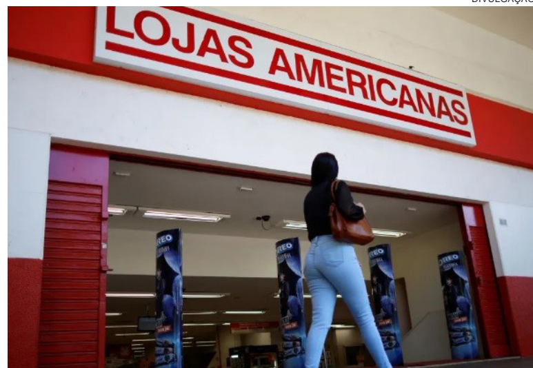
Polícia Federal deflagrou operação para apurar eventuais irregularidades no rombo financeiro da gigante do varejo