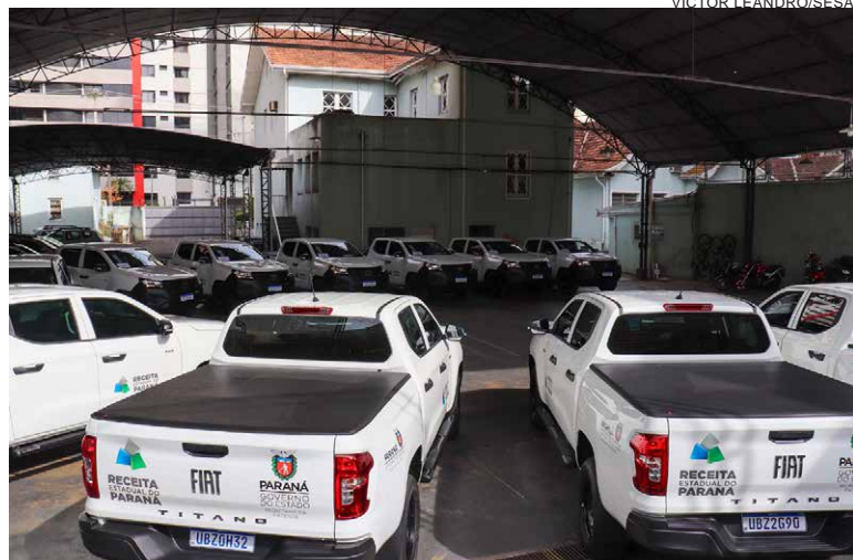
Veículos serão distribuídos entre as Delegacias Regionais localizadas nos municípios de Curitiba, Ponta Grossa, Guarapuava, Jacarezinho, Londrina, Maringá, Cascavel, Umuarama e Pato Branco

O tema ganha relevância às vésperas da primeira audiência pública sobre a nova concessão da malha ferroviária Sul, prevista para o dia 18, em Brasília, quando serão discutidas diretrizes para o futuro do sistema, atualmente sob gestão da Rumo Logística.