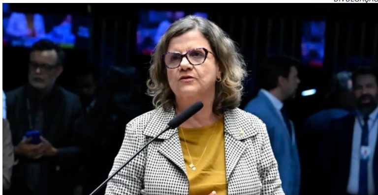
COM a saída de Jaques Wagner, Lula anunciou a senadora Teresa Leitão como nova líder do governo no Senado

A confirmação da saída veio após uma reunião entre Lula e o senador. Em nota divulgada nas redes sociais, Jaques afirmou que a decisão foi tomada em comum acordo e classificou o encontro com o presidente