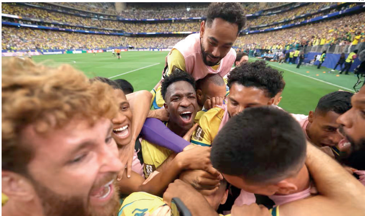
FESTA brasileira com vitória aos 50 minutos do segundo tempo

Com a classificação, a CBF garante mais US$ 15 milhões (R$ 78 milhões na cotação