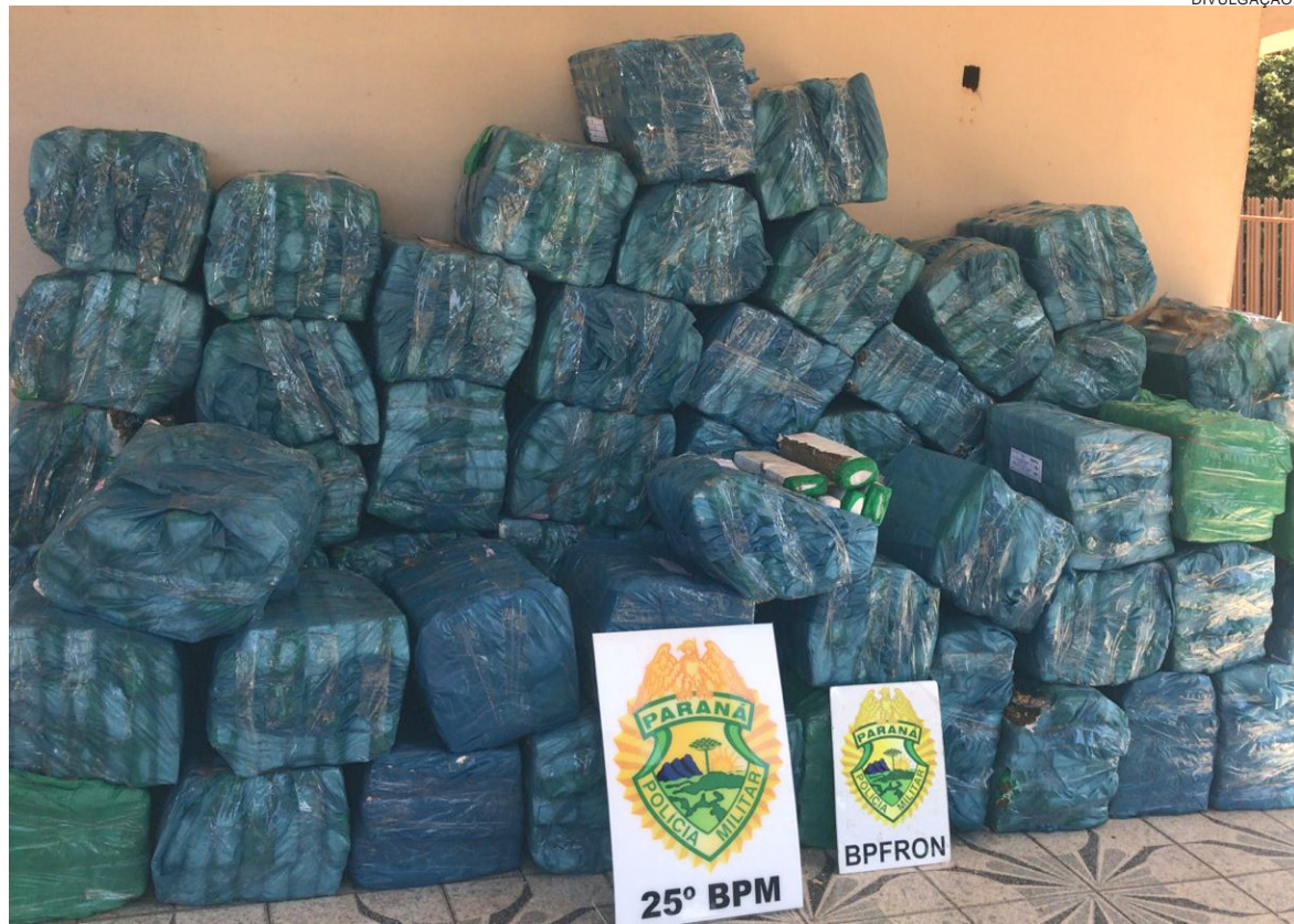
A DROGA era transportada em um caminhão. O motorista afirmou que receberia R$ 4 mil para levar até Curitiba

Além da droga, a Polícia Militar apreendeu o caminhão utilizado no transporte e um aparelho celular que estava em posse do motorista. Todo o material foi encaminhado,