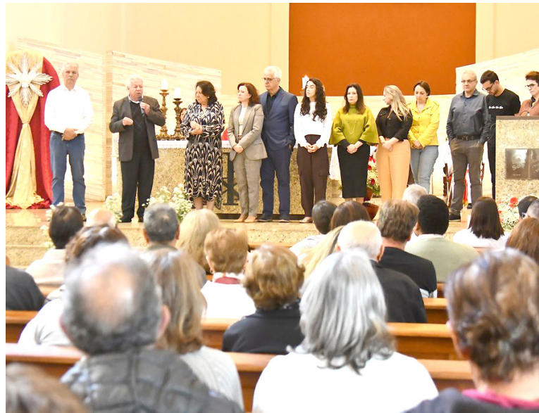
AS CELEBRAÇÕES religiosas encerraram a programação festiva pelo 71º aniversário – além da missa, foram celebrados cultos, nas igrejas Batista Shalom e Betel

Outro ponto alto foi a apresentação do Ministério de Música, que executou ao vivo o Hino Oficial de Umuarama. A interpretação emocionou os presentes e reforçou o sentimento de pertencimento e gratidão pela história construída ao longo de mais de sete dé-