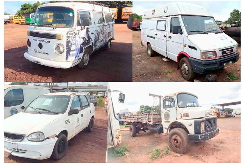
O LEILÃO reuniu dezenas de bens que já não atendem às necessidades operacionais da Prefeitura de Umuarama

“Estamos promovendo a destinação adequada de bens que já não atendem às necessidades do município, reduzindo custos de manutenção e armazenamento e permitindo que esses recursos sejam revertidos em novos investimentos para melhorar os serviços prestados à população”, destacou.