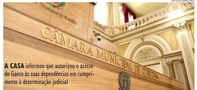
A CASA informou que autorizou o acesso do Gaeco às suas dependências em cumprimento à determinação judicial