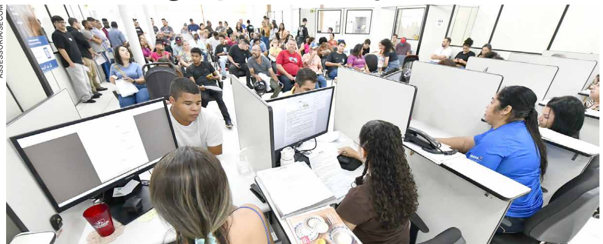
ALÉM das vagas destinadas à nova unidade, a Agência segue realizando encaminhamentos para empresas de vários outros setores

Quem ainda não possui currículo ou necessita de ajuda para elaborá-lo poderá contar com o apoio da equipe técnica da própria agência, que oferece orientação gratuita aos candidatos durante o período do mutirão.