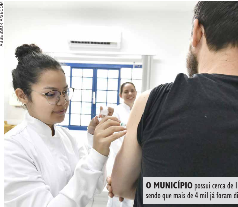
O MUNICÍPIO possui cerca de 10 mil doses disponíveis em sua rede de frio, sendo que mais de 4 mil já foram distribuídas para as Unidades Básicas de Saúde

Segundo a secretária, embora a vacina não impeça totalmente a infecção pelo vírus da gripe, ela reduz significativamente o risco de complicações, como pneumonias, insuficiência respiratória e necessidade de internação hospitalar, além de diminuir a circulação do