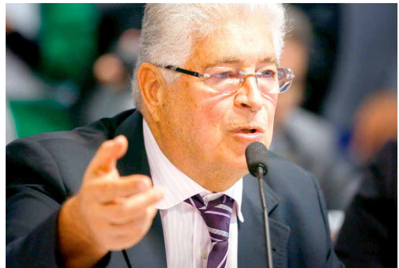
A DECISÃO monocrática do ministro do STF Gilmar Mendes foi proferida no início deste mês, no âmbito de uma Reclamação Constitucional

Na ocasião, o colegiado considerou que a interrupção imediata de benefícios pagos por muitos anos, recebidos de boa-fé e destinados a pessoas idosas sem possibilidade de retorno ao mercado de traba-