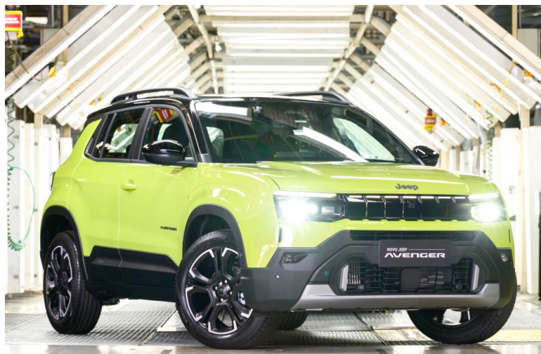
NOVO Jeep Avenger estreia nova plataforma associada à tecnologia híbrida MHEV em Porto Real, no Rio de Janeiro

A chegada do Novo Jeep Avenger é o principal vetor do ciclo de investimentos de R$ 3 bilhões destinados exclusivamente à modernização e expansão de Porto Real até 2030 — parte do aporte histórico de R$ 32 bilhões da Stellantis na região. O impacto do novo modelo na cadeia produtiva é tão expressivo que a compa-