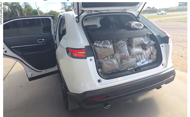
O HONDA HR-V utilizado no transporte da carga ilícita também foi apreendido. Todo o material foi encaminhado à delegacia da Polícia Civil

Entre os mortos estavam quatro homens, sendo três co-