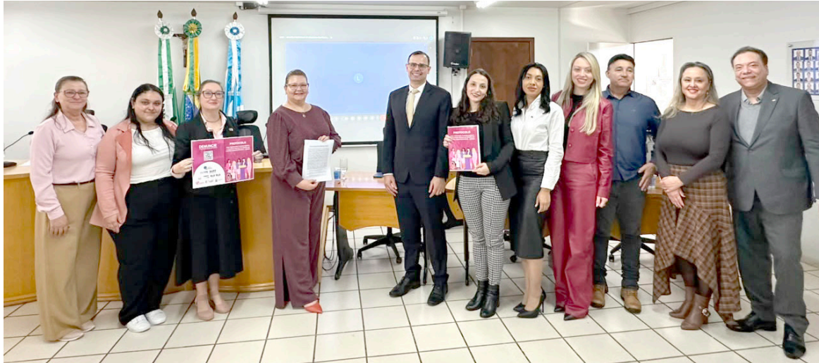
A VIOLÊNCIA política de gênero engloba ameaças, constrangimentos, perseguições, humilhações, discriminação, ataques virtuais e outras formas de intimidação

Além da responsabilização dos autores, o acordo pretende estruturar uma rede municipal de apoio capaz de ofere-