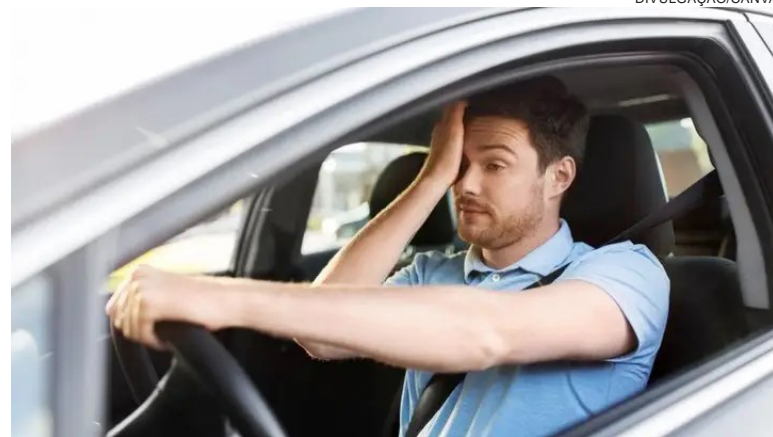
DORMIR pouco ou mal pode ser tão perigoso quanto dirigir sob efeito de álcool

No caso da apneia, o sono é interrompido diversas vezes durante a noite, reduzindo a