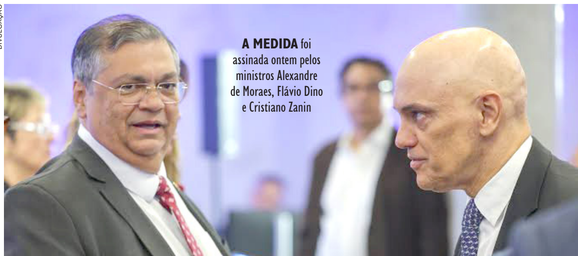
A MEDIDA foi assinada ontem pelos ministros Alexandre de Moraes, Flávio Dino e Cristiano Zanin

O Supremo Tribunal Federal (STF) determinou que sete Tribunais de Justiça apresentem, em até 48 horas, esclarecimentos sobre pagamentos feitos a magistrados após a decisão da Corte que limitou os chamados “penduricalhos”, verbas que ampliam a remuneração de juízes. A medida foi assinada nesta segunda-feira (6) pelos ministros Alexandre de Moraes, Flávio Dino e Cristiano Zanin.