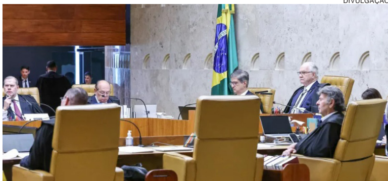
OS MINISTROS exigiram que os presidentes dos tribunais detalhem os valores pagos a magistrados da ativa e aposentados entre abril e julho deste ano

O TJ do Distrito Federal informou que os maiores pagamentos ocorreram devido à aposentadoria de duas magistradas que possuíam férias