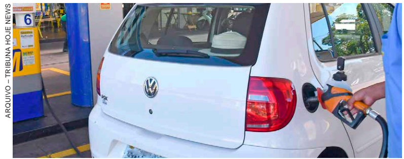
A ESTRATÉGIA evidencia o desafio enfrentado para equilibrar as contas públicas sem repassar ao consumidor os efeitos da alta