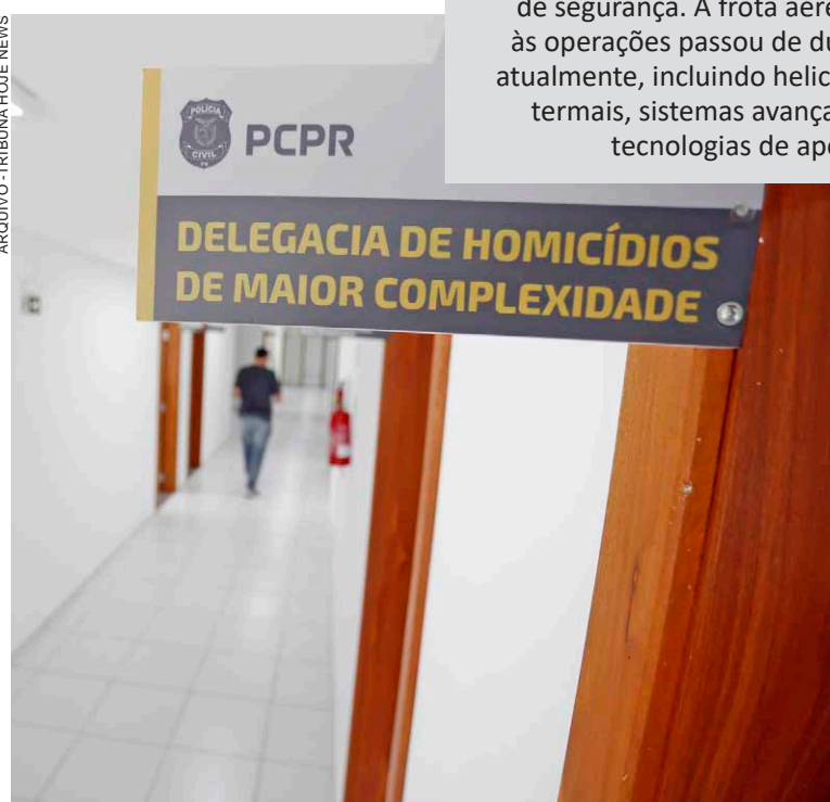
ESTADO ocupa a 4ª posição nacional na elucidação de homicídios, impulsionado por tecnologia, inteligência e integração polícia

O avanço dos indicadores acompanha um processo contínuo de fortalecimento das forças policiais iniciado nos últimos anos, com ampliação dos investimentos em segurança pública, modernização tecnológica e reorganização das estruturas de atendimento à população. O orçamento da Secretaria de Estado da Segurança Pública (Sesp) passou de R$ 4,13 bilhões em 2019 para R$ 6,42 bilhões em 2025, garantindo mais recursos para equipamentos, infraestrutura e ampliação da capacidade operacional das forças policiais.