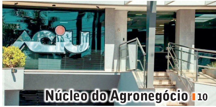
Núcleo do Agronegócio | 10