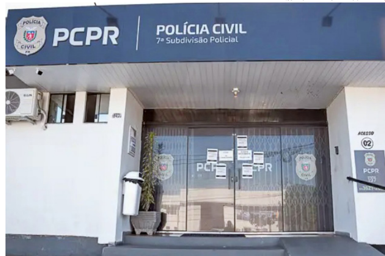
SEGUNDO a Polícia Civil, os investigados são um comerciante de 59 anos e outro homem, de 38 anos. A hipótese é de vítima furtou dinheiro e foi perseguida pela dupla

A vítima vivia em situação de rua e, até o momento, não foi oficialmente identificada. A Polícia Civil continua realizando diligências para descobrir sua identidade e localizar possíveis familiares, além de dar continuidade às medidas judiciais contra os investigados.