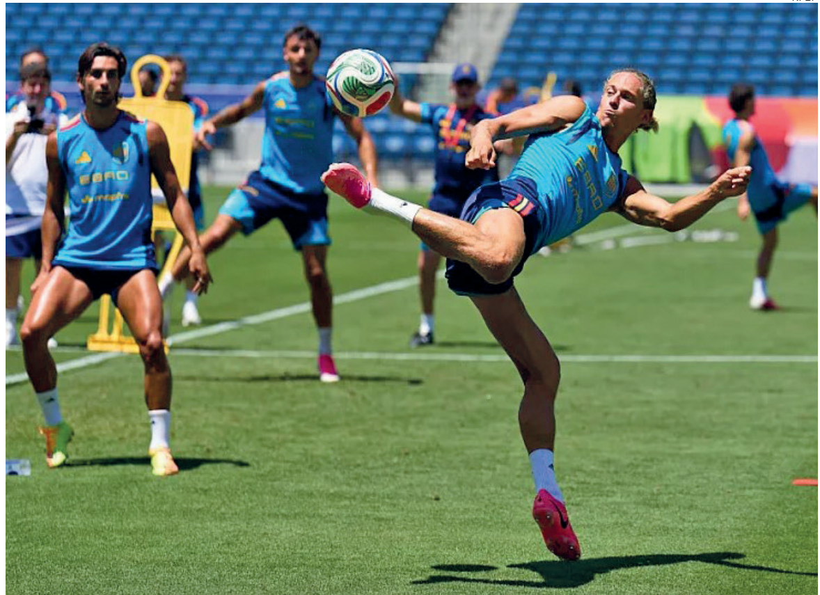
Espanha pode ampliar histórico no jogo de hoje

Bélgica - Courtois; Castagne, Ngoy, Mechele e De Cuyper; Tielemans, Vanaken, Nicolas Raskin, Trossard e Lukebakio; De Ketelaere.