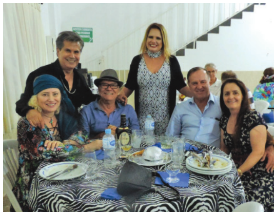
COM amigos do Lions Club que foram curtir a data festiva