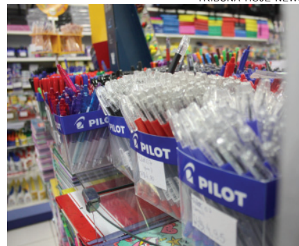
PROCON orienta consumidores sobre cuidados na hora de comprar material escolar

Os produtos regulamentados pelo Inmetro são: apontador, borracha e ponteira de borracha, caneta esferográfica/roller/gel, caneta hidrográfica (hidrocor), giz de cera, lápis (preto ou grafite), lápis de cor, lapiseira, marcador de texto, cola (líquida ou sólida), corretor adesivo, corretor em tinta, compasso, curva francesa, esquadro, normógrafo, régua, transferidor, estojo, massa de modelar, massa plástica, merendeira/lancheira com ou sem seus acessórios, pasta com aba elástica, tesoura de ponta redonda e tinta (guache, nanquim, pintura a dedo plástica, aquarela).