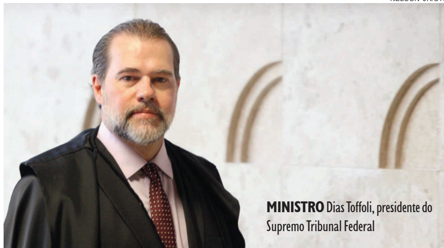
MINISTRO Dias Toffoli, presidente do Supremo Tribunal Federal

Na próxima sexta-feira, dia 15, o governador Ratinho Junior recebe o presidente do STF, ministro Dias Toffoli, para um almoço em petit comité no Palácio Iguazu. Ratinho vai apresentar o Programa de Integridade e Compliance, pioneiro na administração pública, e falar sobre a posição do Paraná em relação à carta encaminhada na semana passada ao