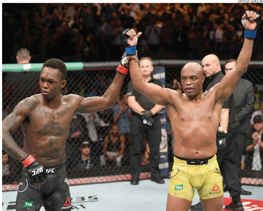
ISRAEL Adesanya e Anderson Silva podem pegar até seis meses de suspensão médica