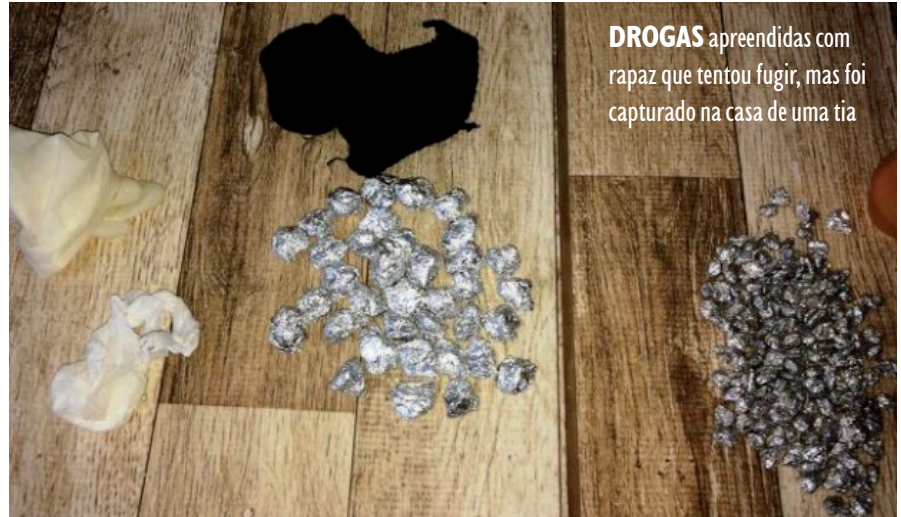
DROGAS apreendidas com rapaz que tentou fugir, mas foi capturado na casa de uma tia