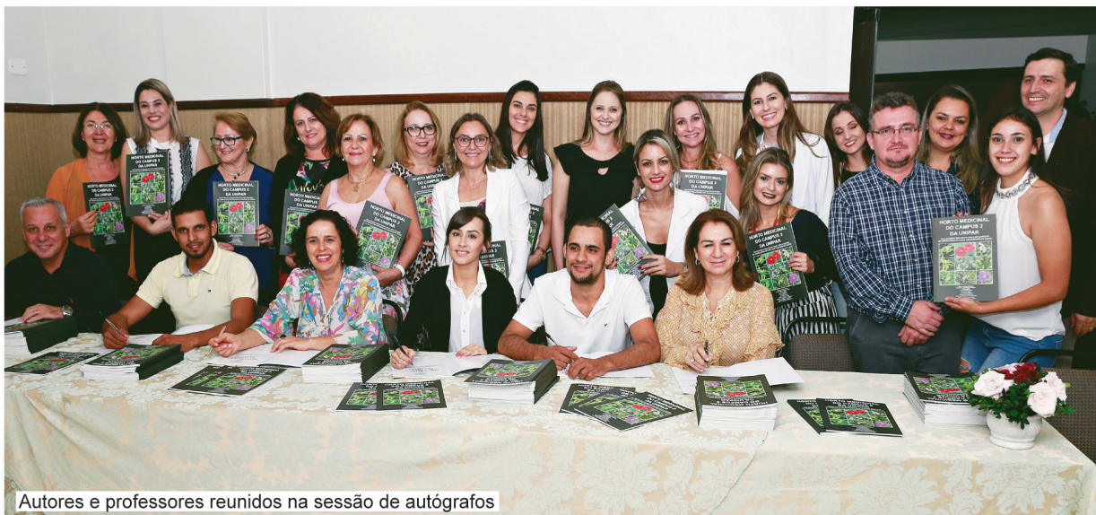
Autores e professores reunidos na sessão de autógrafos