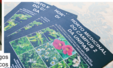
Obra reúne artigos científicos e didáticos