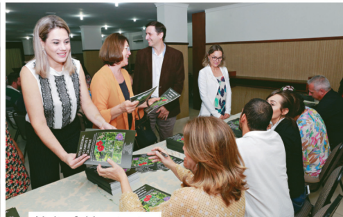
Noite foi bastante prestigiada