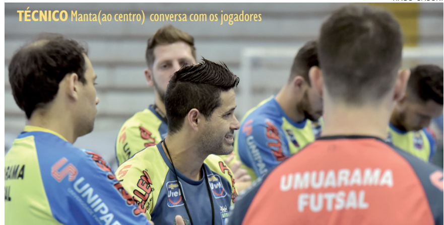
TÉCNICO Manta (ao centro) conversa com os jogadores

A respeito da última derrota, o técnico explica que o futebol é uma caixa de surpresa e não tem como prever qual vai ser o desempenho do time adversário. “Todos têm o objetivo de jogar bola e ver ela entrar, de fazer o gol, mas o time adversário também pode segurar o jogo, atuar mais na