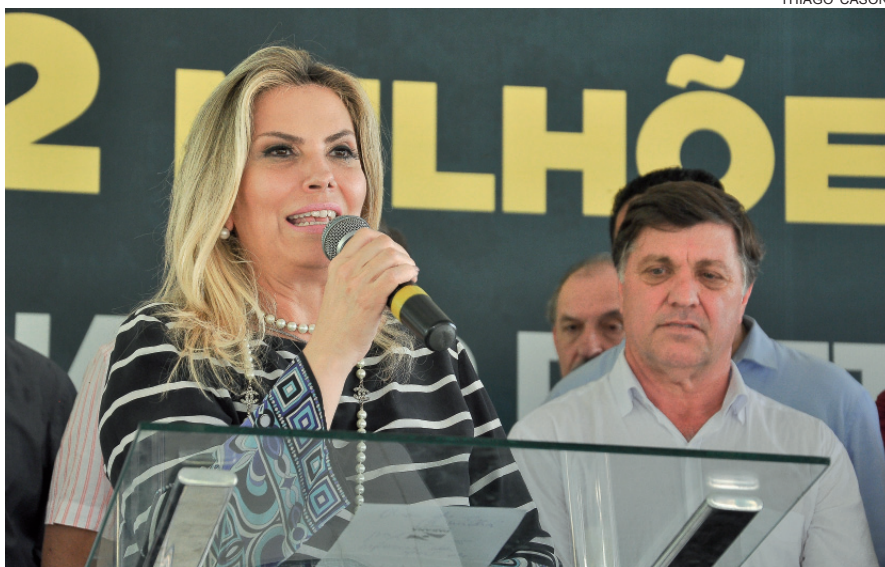
GOVERNADORA confirmou presença no debate

Para o encontro, acatando decisão tomada pelos representantes das associações regionais de municípios do Paraná em reunião promovida no dia 6 de junho, foram convidados os pré-candidatos Ratinho Junior (PSD), Osmar Dias (PDT), Cida Borghetti (PP) e Dr. Rosinha (PT). O critério para a escolha dos nomes foi a sua posição em pesquisa pré-eleitoral veiculada pelo principal veículo impresso de comunicação do Estado, o jornal Gazeta do Povo , no dia 9 de abril de 2018.