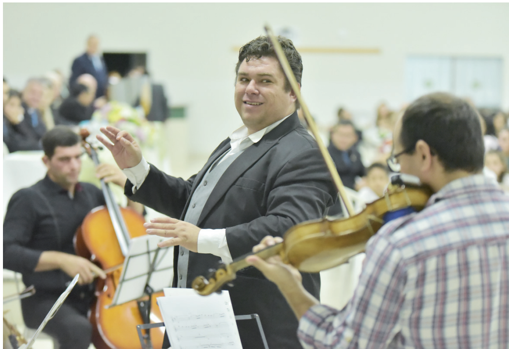
ORQUESTRA Experimental de Repertório de Umuarama