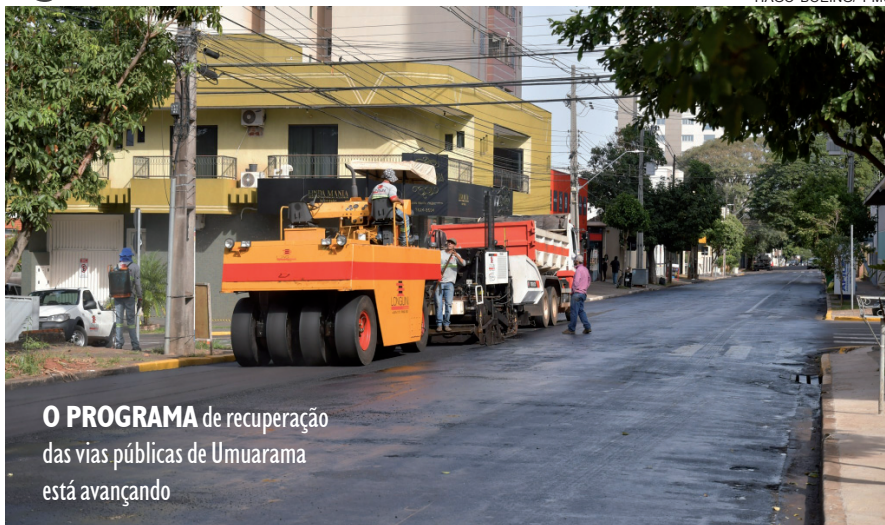
O PROGRAMA de recuperação das vias públicas de Umuarama está avançando

O prazo de execução de 270 dias, porém os serviços estão bem adiantados. Nesta segunda-feira, 2, o recapeamento foi aplicado sobre um trecho da Rua Doutor Camargo, que recebe a melhoria en-