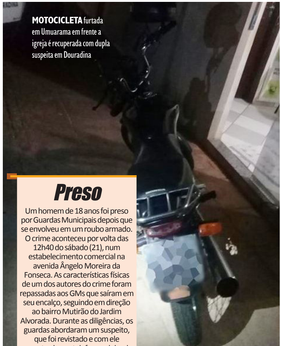
MOTOCICLETA furtada em Umuarama em frente a igreja é recuperada com dupla suspeita em Douradina

Assim que foi descoberto o crime de furto em Umuarama, a dupla recebeu voz de prisão, pois eram maiores de idade (19 e 26 anos). Ambos foram conduzidos à Delegacia de Polícia de Douradina, juntamente com a motocicleta recuperada, que foi colocado à disposição do proprietário.