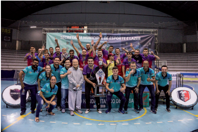
A EQUIPE Kaskata/JM Manutenções consagrou-se campeã na Chave Prata

Depois de 110 jogos, a equipe campeã da Chave Prata de 2018 foi finalmente conhecida. A equipe Kaskata/JM Manutenções foi a grande vencedora na decisão do Campeonato Citadino de Futsal Fuji Moto Honda Chave Prata, que contou com a presença de aproximadamente 1200 pessoas na noite da última sexta-feira, 20, no Ginásio de Esportes Professor Amário Vieira da Costa. A decisão do título foi bastante equilibrada e o campeão só saiu após cobranças da marca do pênalti.