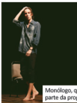
Monólogo, que fez parte da programação