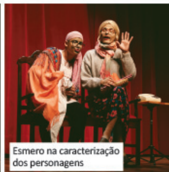
Esmero na caracterização dos personagens