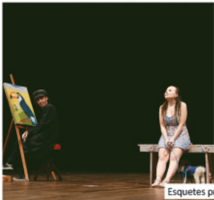
Esquetes provocaram riso