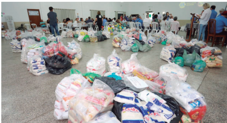
FORAM arrecadados 8 toneladas na Expo 2019, duas toneladas a mais que na Expo do ano passado