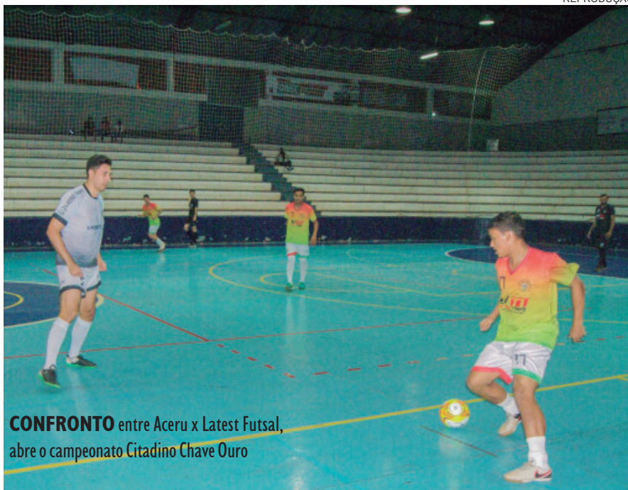
CONFRONTO entre Aceru x Latest Futsal, abre o campeonato Citadino Chave Ouro

A próxima rodada do campeonato acontece na sexta-feira (22) e terá confrontos entre Auto Escola Barbosa/Lébrão Importados contra o Carepar Nutrirama Animal. Este