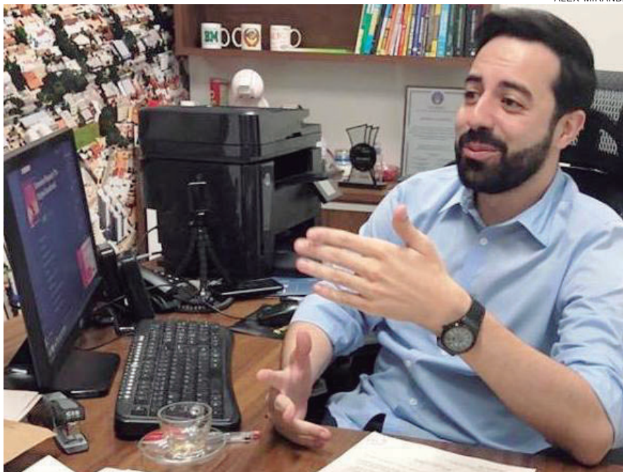
VEREADOR quer informações sobre eventual concurso para contratação de guardas Municipais

guardas, sendo que o último concurso foi em 2005. As pessoas questionam o porquê do não funcionamento de programas e comentam que é pelo baixo efetivo”, diz.