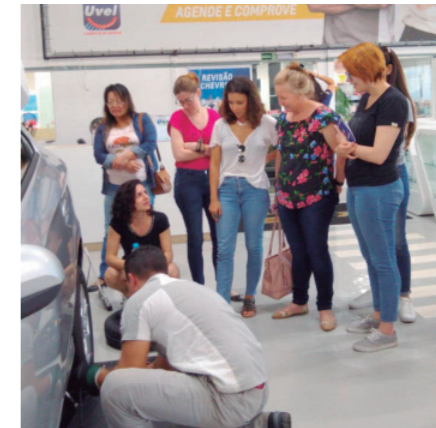
Aula troca de pneus