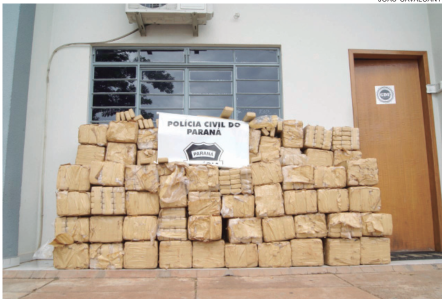
MACONHA apreendida em fevereiro pesou mais de uma tonelada e meia

Na sequência das investigações, os policiais conseguiram coletar indícios que apontam para A. como sen-