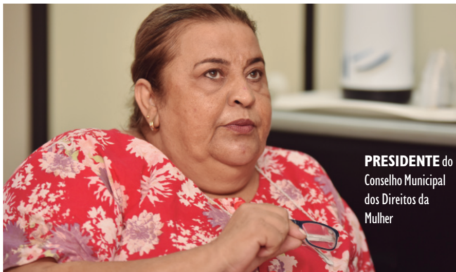
PRESIDENTE do Conselho Municipal dos Direitos da Mulher

palmente as que ainda convivem em situação de submissão”, aponta.