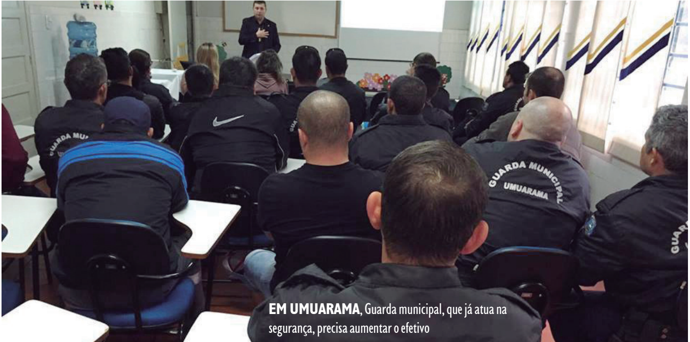
EM UMUARAMA, Guarda municipal, que já atua na segurança, precisa aumentar o efetivo

O presidente Michel Temer sugeriu ontem (7) em reunião com prefeitos, que as guardas municipais tenham maior participação na segurança das cidades. Na abertura da reunião com os gestores municipais, realizada nesta manhã no Palácio do Planalto, Temer enfatizou que o tema da segurança não deve ser uma preocupação restrita aos estados e pediu que os prefeitos se reúnam com os comandantes das guardas municipais para mobilizá-los em ações preventivas.