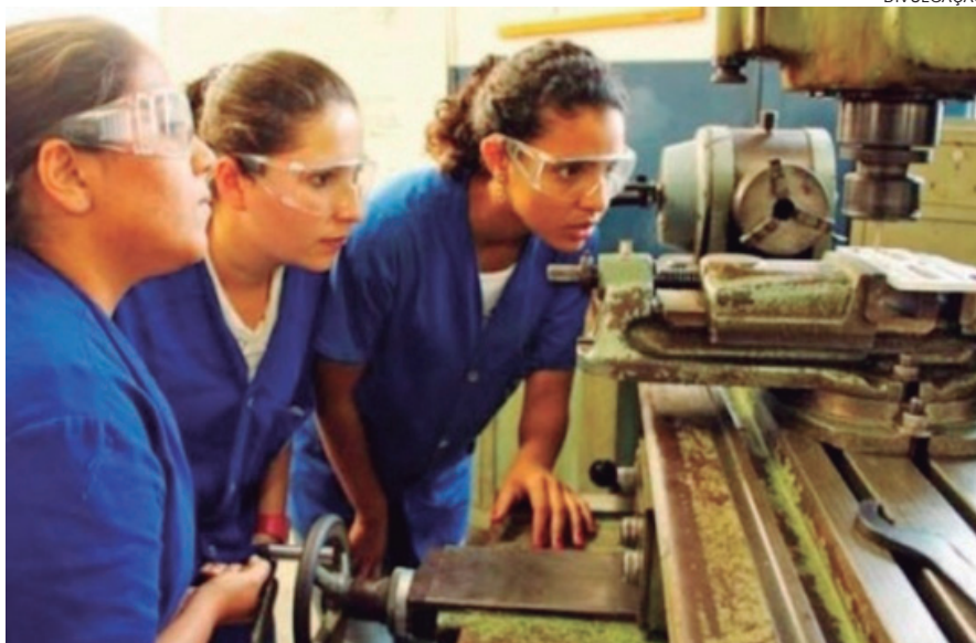
AS MULHERES são em maior número com curso superior, mas ganham menos

Em relação ao rendimento habitual médio mensal de todos os trabalhos e razão de rendimentos, por sexo, entre 2012 e 2016, as mulheres ganham, em média, 75% do que os homens ganham. Isso significa que as mulheres têm rendimento habitual médio mensal de todos os trabalhos no valor de R$ 1.764, enquanto os homens, R$ 2.306.