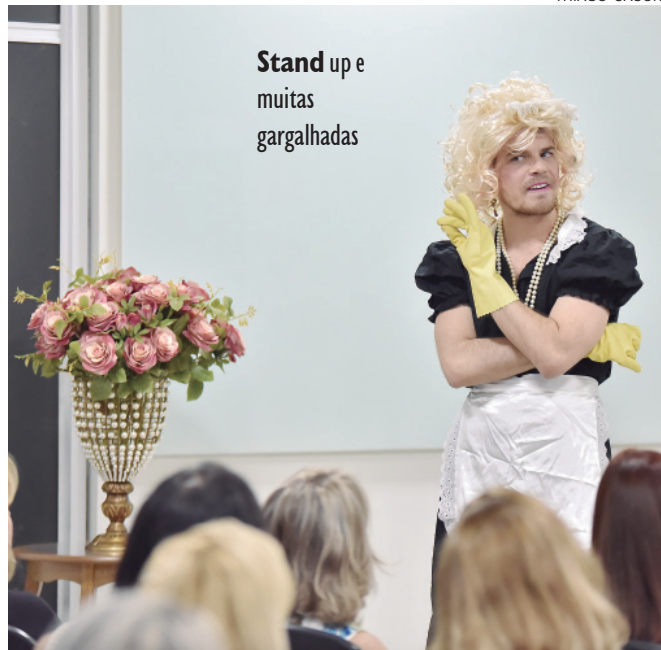
Stand up e muitas gargalhadas