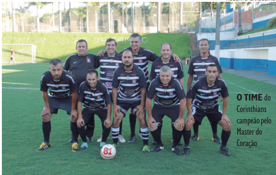
O TIME do Corinthians campeão pelo Master do Coração