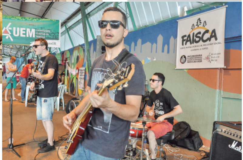
Banda Velho Dino