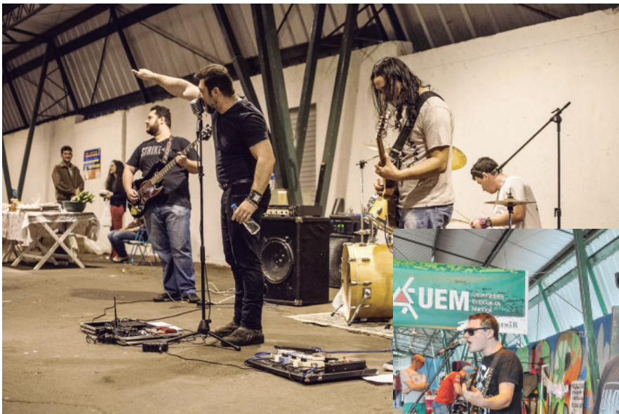
Banda Cavern Club

Além de mostrar seu talento, as bandas estarão concorrendo aos prêmios de R$ 1.500,00 para o 1º primeiro Lugar; R$ 1.000,00 para o 2º Lugar e de R$ 800,00 para o 3º Lugar. Foram selecionadas para participar as bandas Alyne Angel, Carolina Reaper, Cavern Club, Félas, Ginseng Blues, IFmusic, Lucas Viola, Pétalas, Triângulo das Bermúsicas, Velho Dino. A entrada na Expo Umuarama no dia do Festival será gratuita.