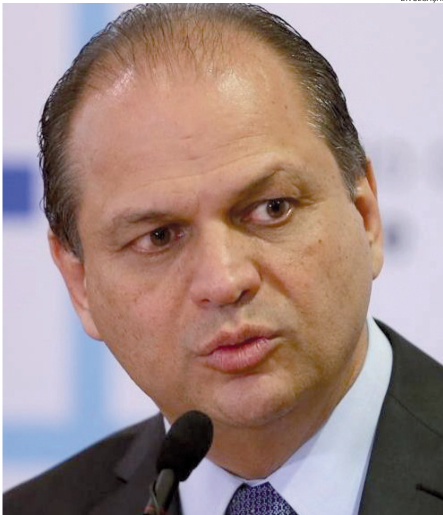
MINISTRO Ricardo Barros, fez o anúncio ontem durante Congresso sobre Saúde

Segundo o ministro, agora o Brasil lidera a oferta de modalidades integrativas na saúde pública, com 5 milhões de usuários em 9.350 estabelecimentos de 3.173 municípios. De acordo com Barros, tais práticas são investimentos em prevenção de saúde, para que as pessoas não fiquem doentes, e evitar que os problemas delas se agravem, que sejam internadas e que se operem, o que gera custos para o sistema e tira qualidade de vida do cidadão.