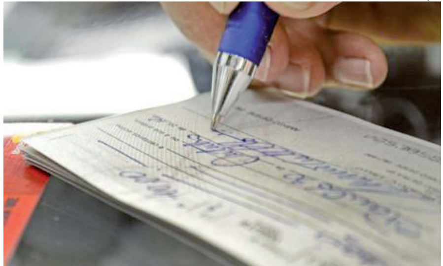
CHEQUE de qualquer valor deve ser compensado em um dia útil

Outro fator que contribuiu para a redução no prazo de compensação, segundo os bancos, foi queda no número de cheques liquidados no país. Em 2017, foram compensados 494 milhões de cheques, 85% menos que o registrado em 1995, quando foram compensados 3,3 bilhões de cheques.