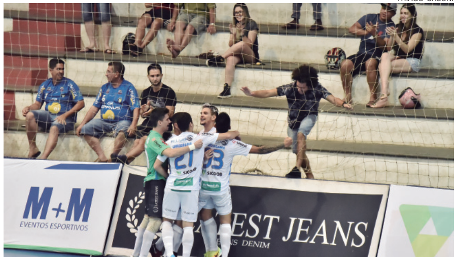
MOMENTO em que o Umuarama faz um gol contra o time de Palmas

A próxima rodada terá Umuarama Futsal Vs Matelândia, em jogo marcado para o Ginásio de Esportes de Medianeira. O próximo jogo em casa será no dia 1º de maio, feriado, uma terça-feira. A partir das 20h30 o Umuarama vai receber o Mufatão de Cascavel. E mais uma vez o apelo para que a torcida compareça e possa dar a sua contribuição, não apenas financeiras, mas de apoio moral à equipe que, em quatro jogos, ganhou três e perdeu um. O desempenho, até agora, pode ser considerado muito bom.