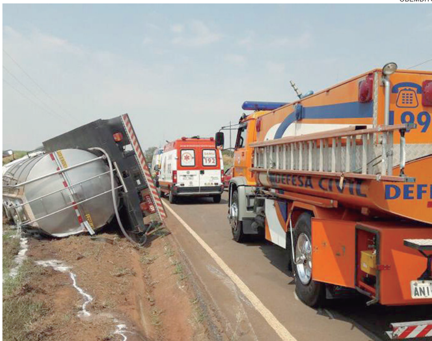
DEFESA Civil de Cruzeiro do Oeste auxilia bombeiros nos atendimentos em geral

A proposta da prefeita é de que eles sejam incorporados ao Bombeiro Militar, uma decisão chamada de militarização. Para isso será criada uma estrutura interna na Secretaria de Saúde.