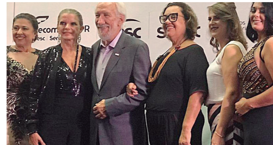
O VICE -governador e as presidentes após a premiação