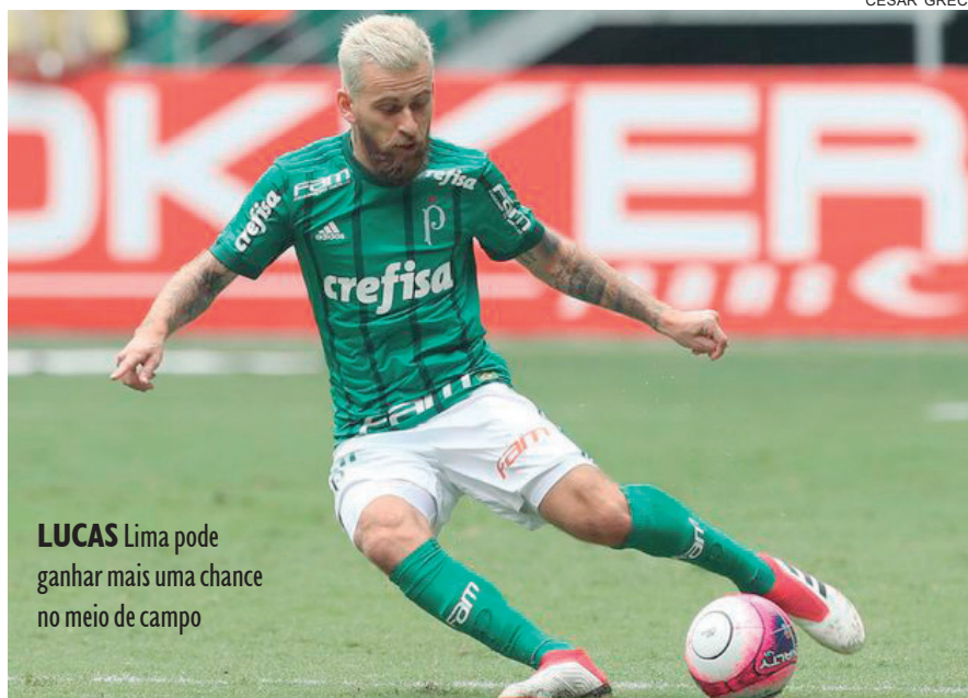
LUCAS Lima pode ganhar mais uma chance no meio de campo

Também devemos ter mudanças no ataque palmeirense. Apesar de ser o artilheiro da última edição, Miguel Borja perdeu espaço e deve dar lugar a Deyverson ou Arthur Cabral no comando de ataque. Com isso o time deve ser formado por: Weverton, Mayke, Luan, Gómez e Diogo Barbosa; Felipe Melo, Bruno Henrique e Lucas Lima; Scarpa, Dudu e Deyverson (A. Cabral).