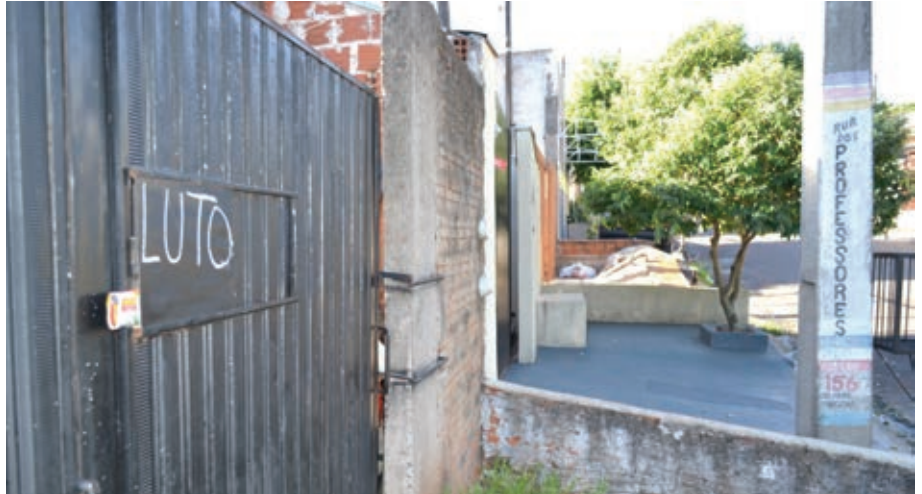
Luto no portão da residência da vítima

Ferido e desorientado, ele foi arrastado até o quintal e morto a golpes de faca pela dupla, que ainda, de acordo com a Polícia Militar, teria fugido. Para tanto, os algozes de Santos contaram com o apoio de um terceiro envolvido, que aguardava em um automóvel, o carro não foi identificado. Os policiais realizaram patrulhamentos na região, mas não encontraram nenhum suspeito. O caso foi repassado para ser investigado pela Polícia Civil.