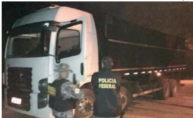
Agentes apreenderam o caminhão, barcos e cigarros contrabandeados do Paraguai