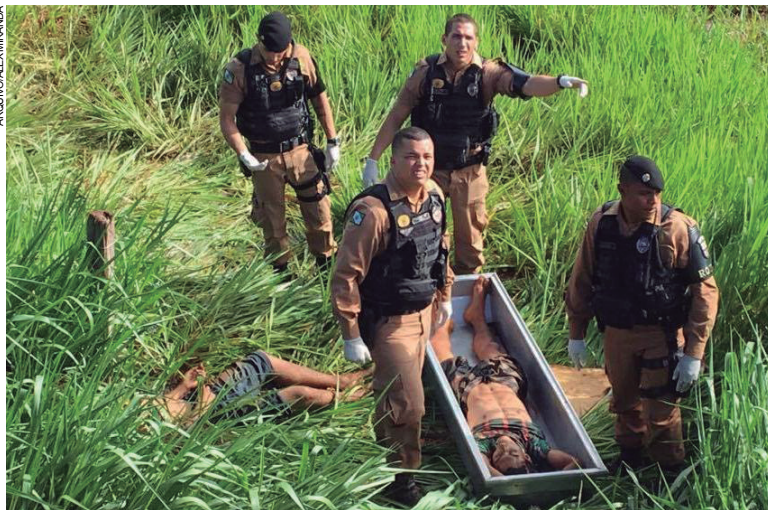
Em janeiro de 2017, dois jovens responsáveis pela morte de um garoto morreram em confronto armado com PMs nos fundos do Parque de Exposições

polícia se deparou com um homem de 22 anos, que reagiu à abordagem policial e morreu num confronto armado.