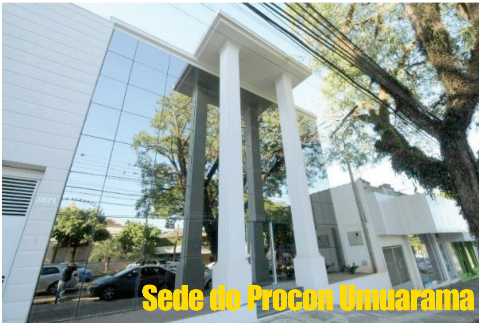
Sede do Procon Umarama

Prefeito fez mudanças também na Acesf e Meio Ambiente