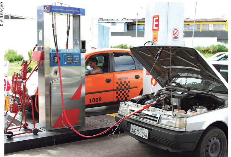
Rede de abastecimento ainda é limitada no Paraná

De acordo com a Companhia Paranaense de Gás, qualquer veículo pode ser convertido para o GNV – o custo para tal fica entre R$ 3 mil e R$ 4 mil. Para garantir a segurança no uso do combustível, é preciso fazer a conversão somente em oficinas credenciadas pelo INMETRO. O procedimento deve passar pelo Departamento de Trâ-