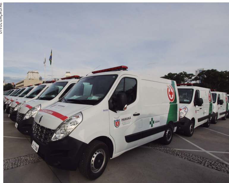
Investimentos em veículos e equipamentos, devem aumentar em 2018

tado da Saúde pôde manter programas estratégicos e apoiar prefeituras, consórcios, hospitais, universidades e instituições da sociedade civil para ampliar o acesso da população a serviços públicos de saúde de qualidade.