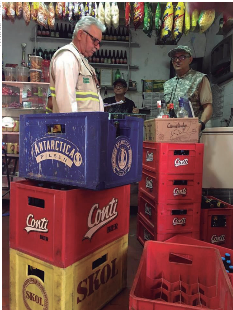
Ação integrada das forças de segurança conduziram desocupados à delegacia e apreenderam bebidas alcoólicas nos bares da rodoviária

Além dele, dezenas de desocupados que estavam perambulando pelo interior da Estação Rodoviária também foram abordados e averiguados. Os que não possuíam documentos pessoais, em sua maioria usuários de drogas (crack), foram separados do restante da população e posteriormente conduzidos à Dele-