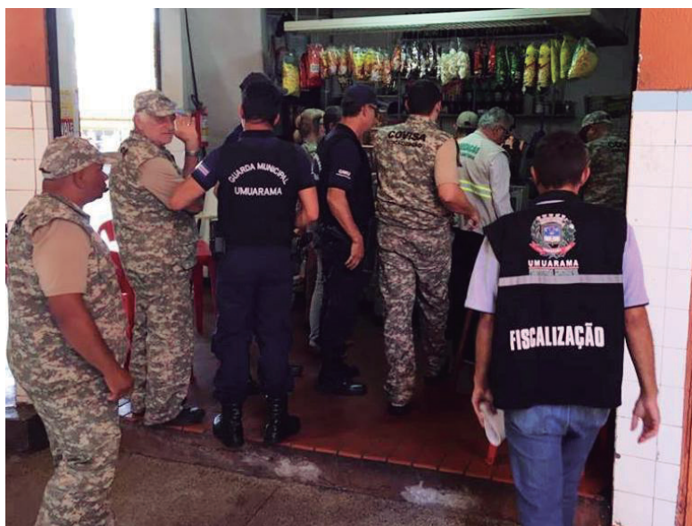
Bares na Estação Rodoviária foram vistoriados pelas equipes da Prefeitura e das forças de segurança do município