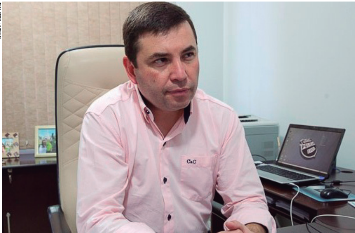
Delegado responsável pelas investigações de homicídios constata que o crime está cada vez mais precoce