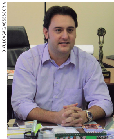
Ratinho Júnior. Deputado Estadual e pré-candidato ao Governo do Paraná

S ou pré-candidato ao Governo do Paraná e em 2018 vamos apresentar aos paranaenses um plano de governo que vem sendo construído com um amplo espectro, reunindo cidadãos e a sociedade civil organizada em todos os segmentos e regiões. Já realizamos encontros em 18 cidades pólo e continuaremos a percorrer todo o Paraná promovendo um modelo inovador de fazer política onde o diálogo é o principal instrumento e a verdade e a transparência os principais alicerces. Estou preparado para ser o próximo