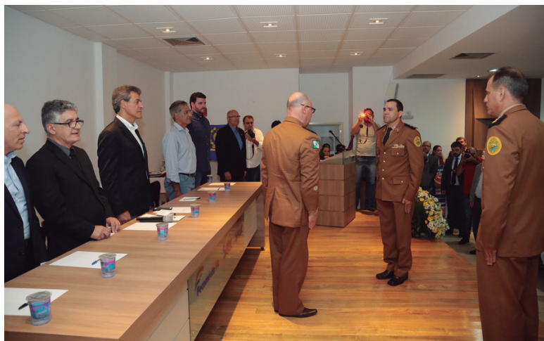
Troca de Comando no 2º Batalhão da Polícia Militar

O governador Beto Richa participou nesta sexta-feira (12) da solenidade de troca do comando do 2º Batalhão da Polícia Militar, com sede em Jacarezinho, no Norte Pioneiro, e enfatizou a importância da corporação e o valor que o Governo do Estado dá aos policiais.