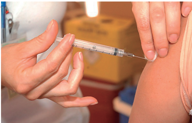
A vacina para quem vai viajar deve ser padrão

aqueles com doenças hematológicas, entre outras).