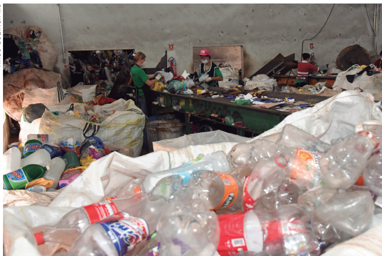
O lixo reciclável é separado por funcionários da cooperativa

Responsáveis pelo setor admitem que é preciso ampliar as ações de conscientização