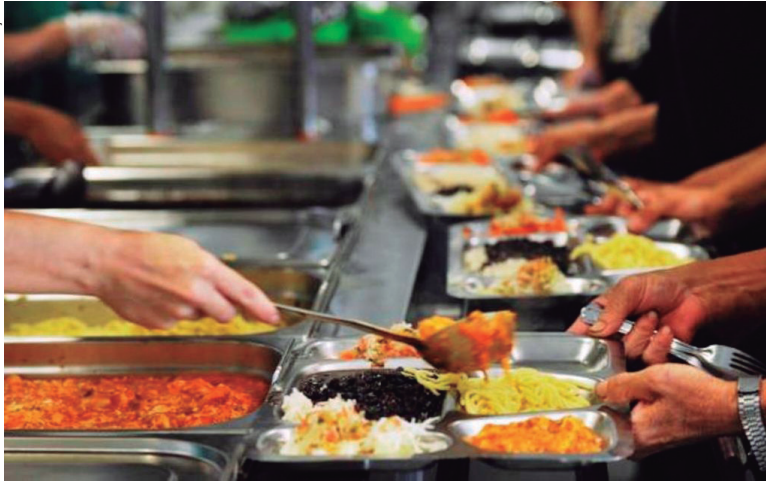
O restaurante vai atender, além de trabalhadores, pessoas de baixa renda