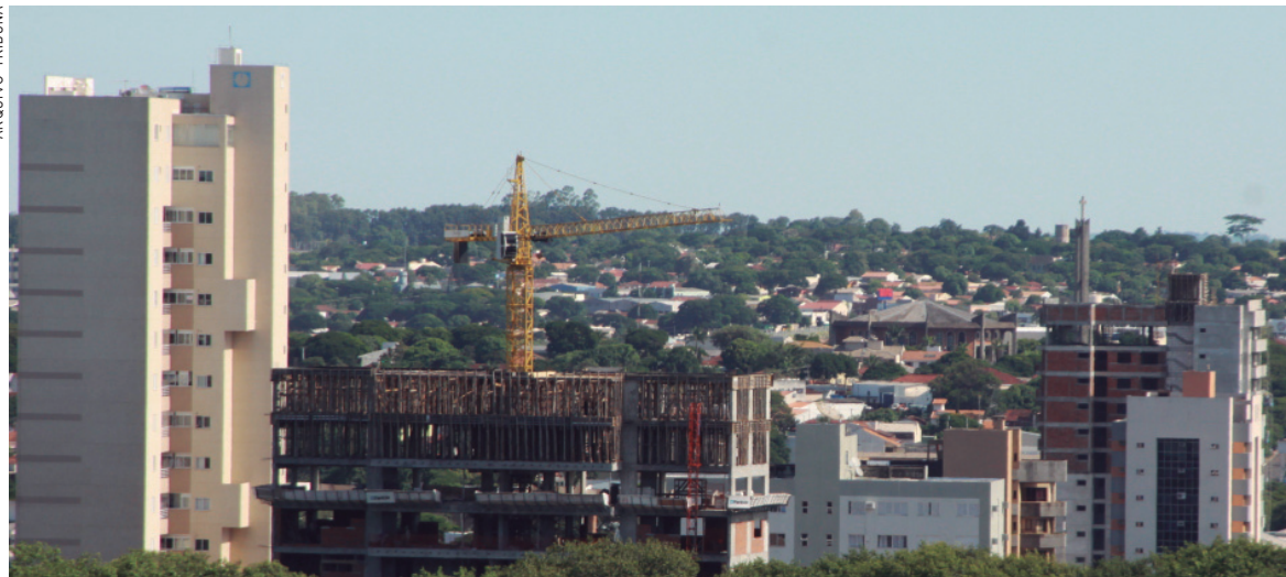
Em Umuarama, cresce a oferta de imóveis para alugar

Usado no reajuste de aluguéis, o Índice Geral de Preços - Mercado (IGP-M) acumula deflação (queda de preços) de 0,34% em 12 meses, de acor-