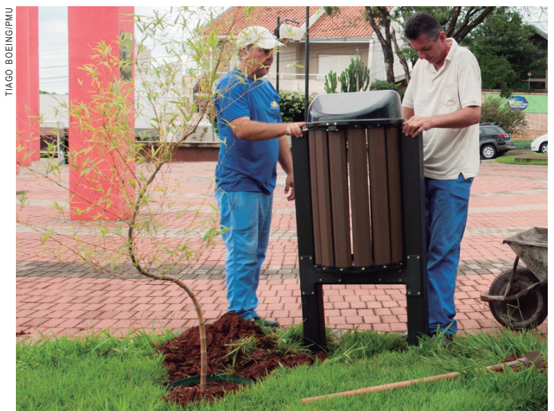
Instaladas as lixeiras, a administração espera que a população utilize e ajude a cuidar

Levando em conta que a produção da madeira plástica retira milhares de toneladas de resíduos da natureza e não envolve desperdício de água, além de ser um material 100% reciclado, o município optou por esta linha de produtos. "O primeiro lote vai ser implantado em cará-