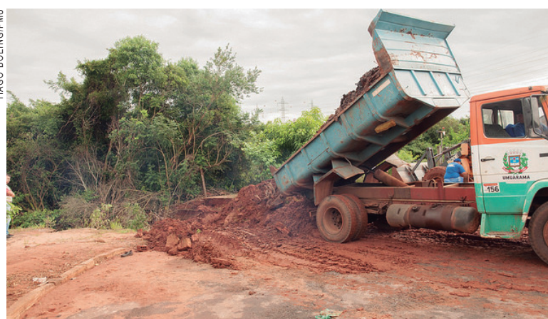
Equipes da Prefeitura trabalham de forma acelerada para recuperar as vias