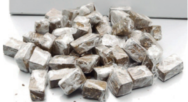
Porções de maconha estavam embaladas e prontas para a venda quando aconteceu a apreensão

Investigadores integrantes do Grupo de Diligências Especiais (GDE) de Umuarama prenderam um homem, ontem (18) pela manhã, envolvido com o tráfico de drogas no Parque Industrial. Diligências foram realizadas pelo bairro quando os policiais se depararam com um homem suspeito saindo de um loteamento na avenida Umuarama, com uma sacola na mão.