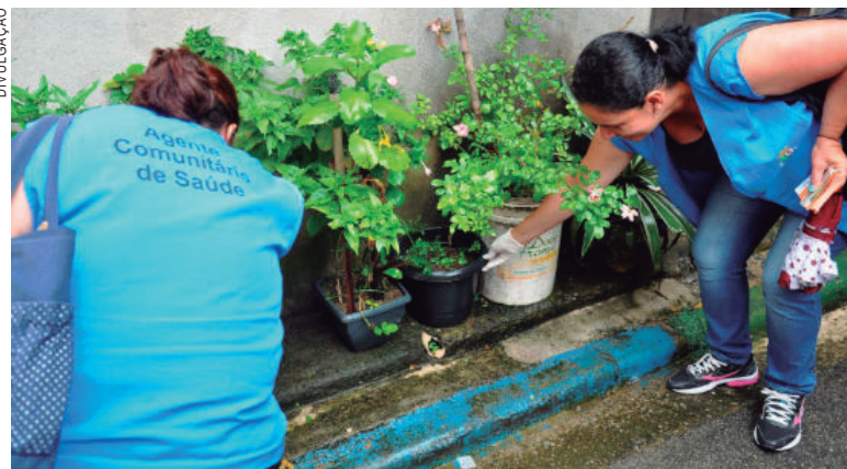
As equipes estarão visitando casas e conscientizando as pessoas sobre o perigo do Mosquito

A ocorrência praticamente diária de chuvas, intercalada com dias de muito calor, dificultam o combate. "Nosso pessoal tem encontrado muitos recipientes com água limpa, parada, nas residências, quintais e terrenos