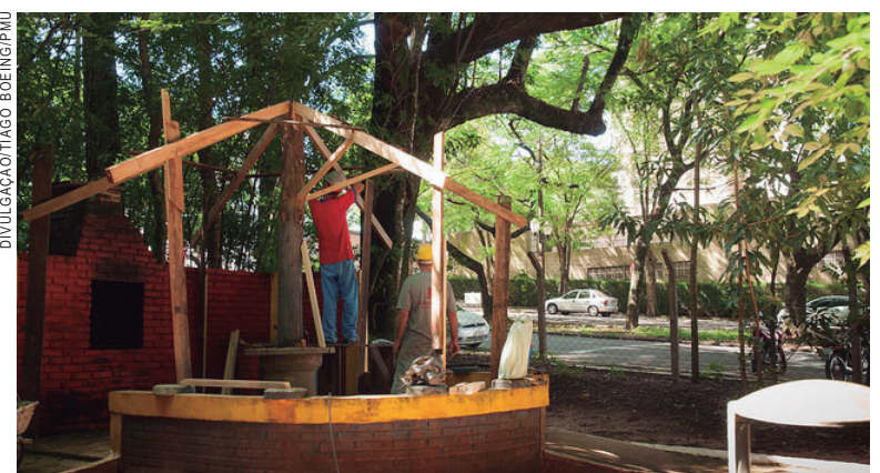
Equipes da Prefeitura trabalham na reforma de equipamentos no Bosque