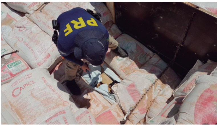
Polícia faz vistoria na carga e se depara com carregamento de maconha

Em mais uma ação da Polícia Rodoviária Federal, na fronteira com o Mato Grosso do Sul, ontem, no final da tarde, uma carreta com 7,2 toneladas de maconha foi apreendida, quando passava pela Unidade do Posto Rodoviário Porto Camargo, próximo à ponte que liga Paraná e Mato Grosso do Sul. Os policiais desconfiaram do motorista e abordaram, realizando vistoria minuciosa do carregamento que, aparentemente, era farelo de trigo, oriundo do estado vizinho. Mas, misturado à carga, foram encontrados os tabletes de maconha, totalizando 7,2 toneladas.