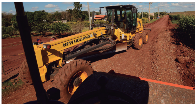
Máquinas da Patrulha Mecanizada, em serviço de recuperação de estradas

A Secretaria de Estado da Agricultura e Abastecimento já abriu licitação para aquisição de mais sete patrulhas mecanizadas (um conjunto de máquinas e caminhões) que farão as obras de adequação, readequação, manutenção e melhorias em estradas rurais. Com isso, o governo do Estado terá 16 patrulhas de máquinas e caminhões auxiliando os municípios, por meio dos Consórcios, na execução de projetos em estradas rurais no Paraná.