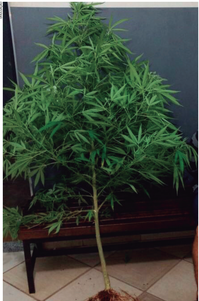
Os PMs encontraram também um pé de maconha com mais de dois metros de altura

Apesar da localização das drogas, os PMs não deram por encerradas as buscas, até que apreenderam ainda a quantia de R$ 390 em espécie, cuja origem o rapaz não soube explicar. O detido foi encaminhado à Delegacia de Polícia de Umuarama e denunciado por tráfico de drogas.