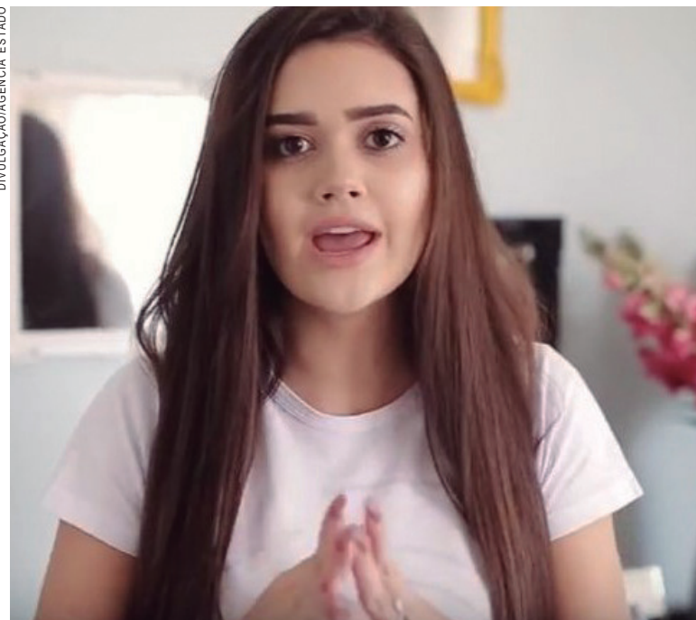
A campanha chama a atenção para o problema da violência contra a mulher jovem

O vídeo de prevenção a violências contra mulheres, direcionado a adolescentes, já atingiu 1,8 milhão de visualizações, 7 mil reações e mais de 1 mil compartilhamentos. A campanha Você Pode Mais – Falando com o Jovem, idealizado pela Secretaria de Estado da Família e Desenvolvimento Social, começou a ser veiculada na internet há apenas uma semana e segue até fim de fevereiro.