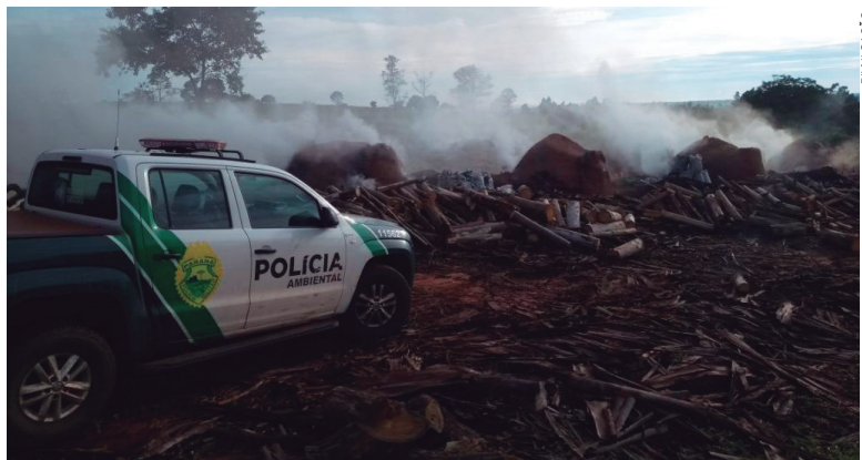
Os fornos foram lacrados e a atividade está suspensa até que o órgão ambiental competente decida pela concessão ou não da licença

Integrantes do Pelotão da Polícia Militar Ambiental de Umuarama fecharam na manhã de ontem (25) uma carvoaria que funcionava ilegalmente dentro de uma propriedade rural em Tapira. Ao todo, nove fornos foram paralisados e 190 sacos de carvão foram apreendidos.