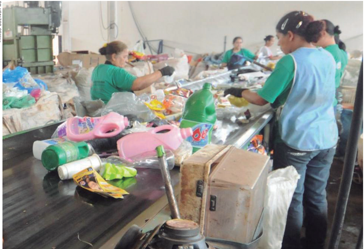
O funcionários da Cooperu manuseiam lixo reciclável e correm risco de acidentes