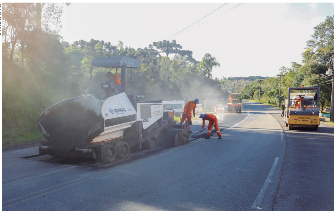
Recuperação de rodovias, absorveu grande volume de recursos