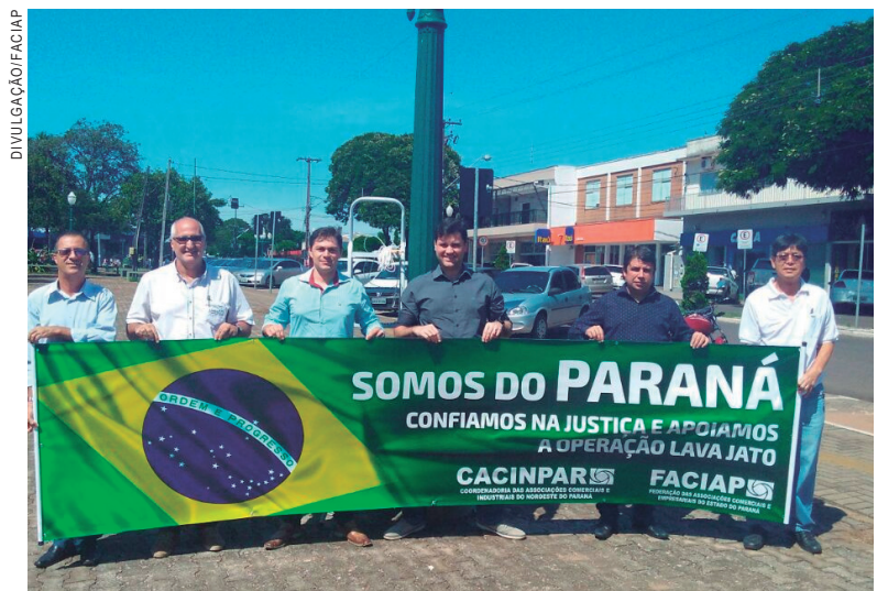
A mobilização da Faciap chegou ao interior do Estado

sários das cidades de Curitiba, Campo Largo, Campo Mourão, Londrina, Cascavel, Maringá, Cianorte, Apucarana, União da Vitória, Pato Branco, Loanda, Alto Paraná, Paranavaí, Nova Londrina, Paraíso do Norte, São João do Caiuá, Terra Rica, Santa Cruz