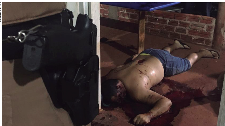
Vendedor autônomo foi executado a tiros de pistola durante galinhada de inauguração de um bar em Altônia

A cena do crime foi isolada até que peritos do Instituto de Criminalística chegassem de Umu-