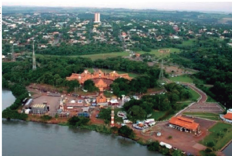
Guaíra vai receber representantes de municípios, para o Fórum das cidades

Prefeito Heraldo Trento destaca importância da tecnologia para controle de gestão; Município é referência na informatização da Saúde e modelo de cidade digital no país