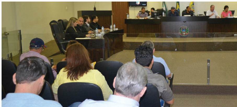
VEREADORES do Noroeste se reuniram na Câmara Municipal de Umuarama para discutir as maneiras de baixar o valor da conta de luz