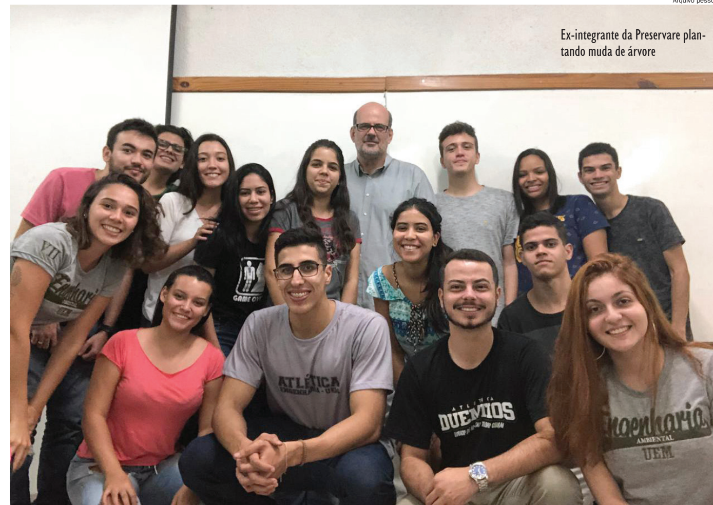
Ex-integrante da Preservare plantando muda de árvore