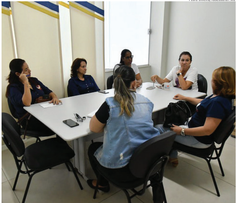
Equipe reunida para discutir ações que serão desenvolvidas neste ano, em agosto

Serão realizadas visitas em hospitais para formações de equipes, que se especializarão nesse tipo de socorro, além da disseminação de conhecimentos às mães que buscam atendimento nas casas de saúde.