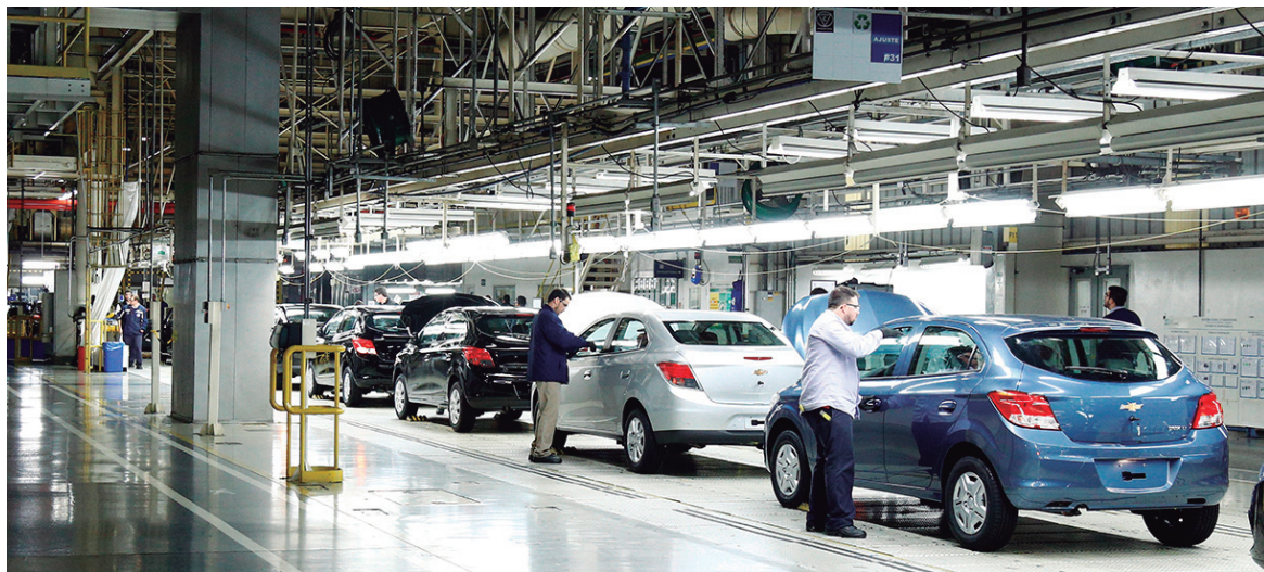
Fábrica da GM em Gravataí: produção aumentando....

As vendas de veículos novos subiram 9,23% no país em 2017, com a comercialização de 2.239.403 automóveis, comerciais leves (como picapes e furgões), caminhões e ônibus, acima do total de 2.050.240 unidades vendidas em 2016. Os números são do balanço divulgado hoje (4) pela Federação Nacional da Distribuição de Veículos Automotores (Fenabrave). Em 2016, a entidade registrou queda de 20,47% nas vendas de veículos.