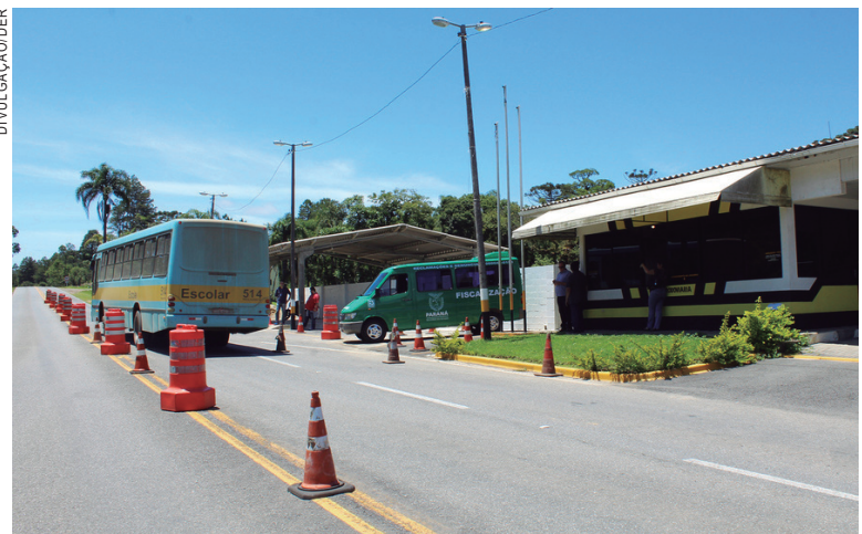
Unidade Móvel Reforça Combate ao Transporte Clandestino de Passageiros