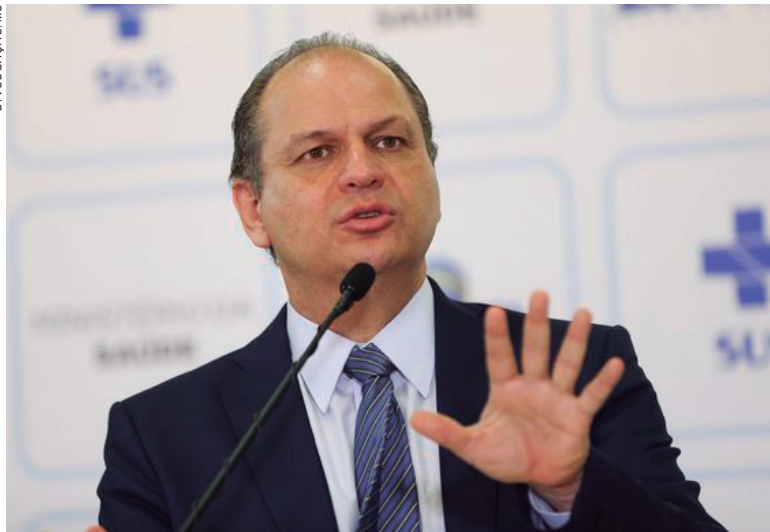
Ricardo Barros, deputado federal com base na Região Noroeste do Paraná

foi o presidente nacional do PRB, Marcos Pereira, entregou à Presidência da República carta pedindo exoneração do cargo de ministro da Indústria, Comércio Exterior e Serviços, alegando questões pessoais e partidárias.