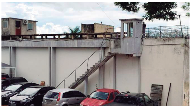
Depois da rebelião, cadeia de Umuarama ainda não foi reformada e já mantém recolhidos mais de 130 presos

Em Umuarama a situação não é tão diferente. O Cadeião Público, que foi construído para abrigar 64 detentos, já passou por inúmeras reformas e adaptações. Até houve a separação por galerias, o que transformou a cadeia num tipo de pequena unidade penitenciária, em que detentos condenados permaneciam junto com os detentos temporários.