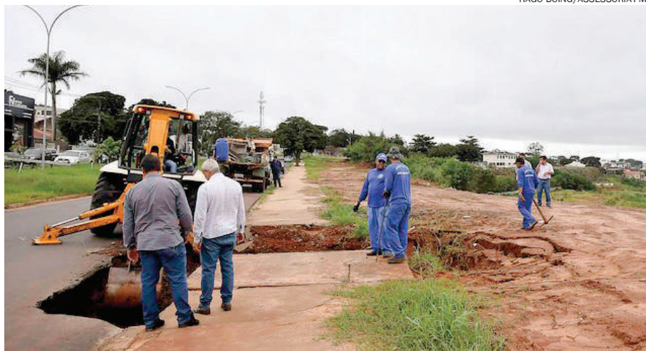
COM retroescavadeira, a equipe abriu o asfalto e removeu os entulhos

Com retroescavadeira, a equipe abriu o asfalto e removeu os entulhos