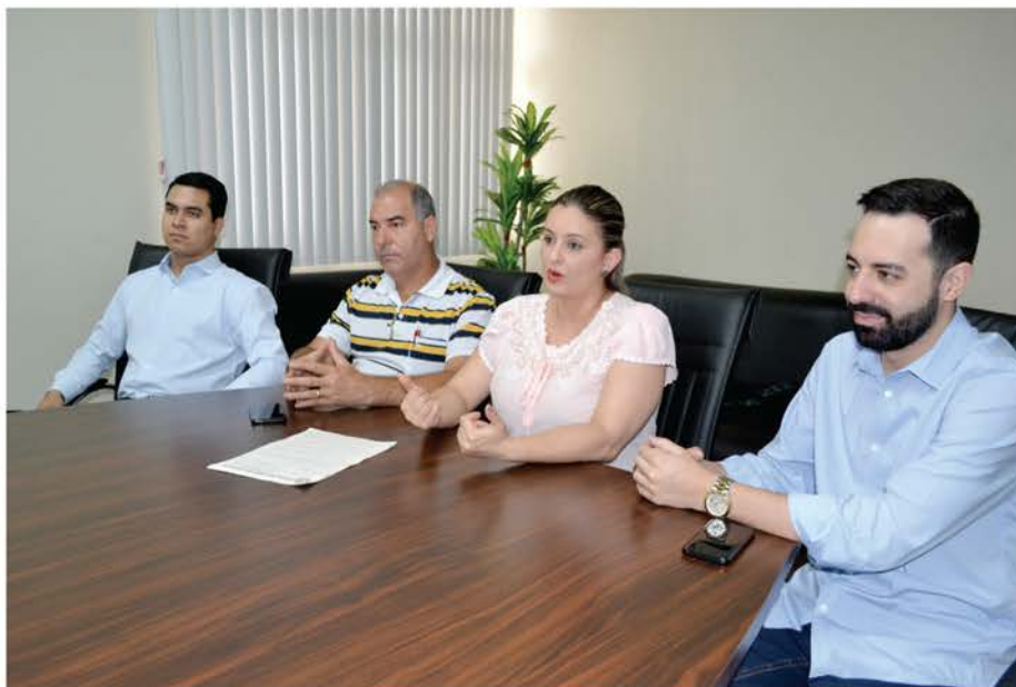
VEREADORES apresentam Moção de Repúdio ao decreto do Presidente da República

De acordo com os parlamentares, o Decreto tira o direito de voto dos Conselhos, privando o poder deliberativo da Sociedade Civil, com prejuízo relevante no acompanhamento, fiscalização e no