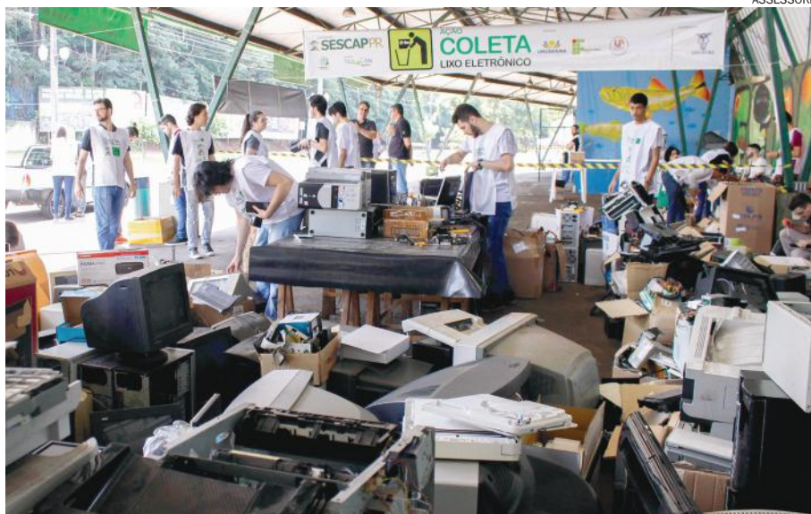
ACADÊMICOS fazem triagem dos equipamentos, verificando o que pode ser reaproveitado

Todo material recebido passou por uma triagem feita pelos acadêmicos da Unipar e do IFPR. Eles verificaram peças e aparelhos que poderiam ser reaproveitados e, depois de consertados, os produtos serão doados para entidades assistenciais. O restante (descartado) foi destinado