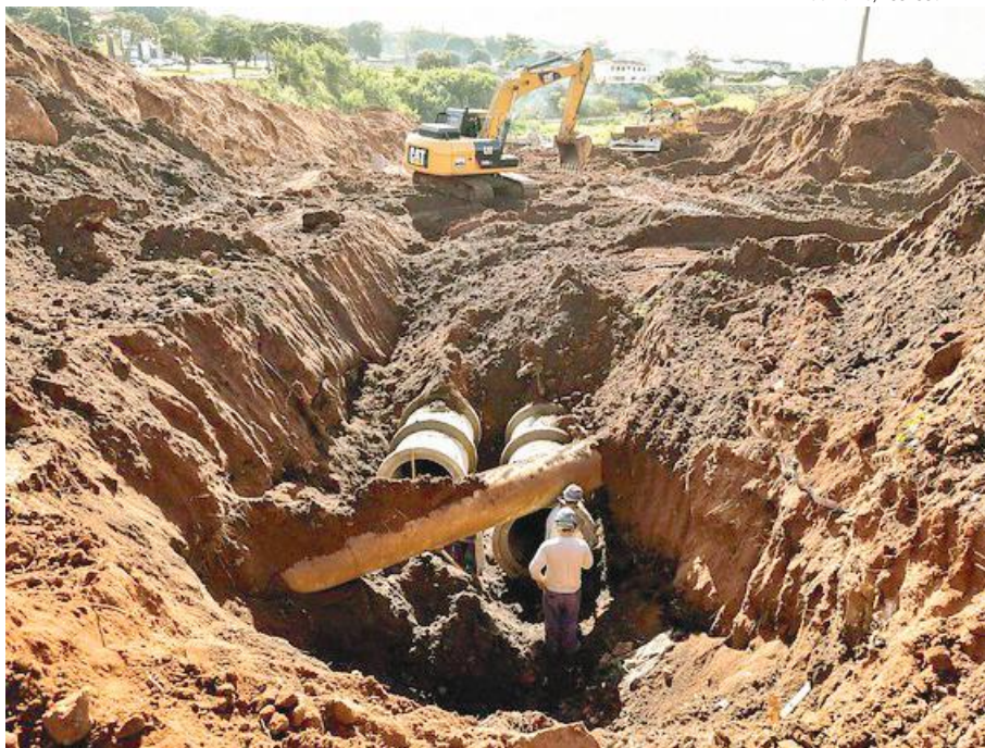
A construção das galerias, poços de visita e caixas de ligação exige escavações profundas e a remoção da cobertura asfáltica

A construção das galerias, poços de visita e caixas de ligação exige escavações profundas e a remoção da cobertura asfáltica em diversos pontos – especialmente nas ruas Macapã e Guaporé, próximo do antigo Completo Poliesportivo, e agora na Ângelo Moreira – chegando à Praça Odete Mossurunga. “A obra eliminará o sério problema de alagamento registrado