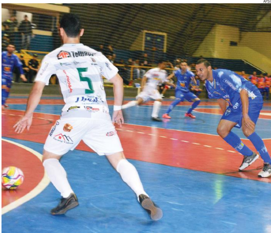
AFSU marca cinco gols no penúltimo jogo da 1ª fase do Campeonato Paranaense

O próximo confronto do Afsu será em casa no próximo sábado (15), contra o São José dos Pinhais, que está em 12º lugar na tabela. A