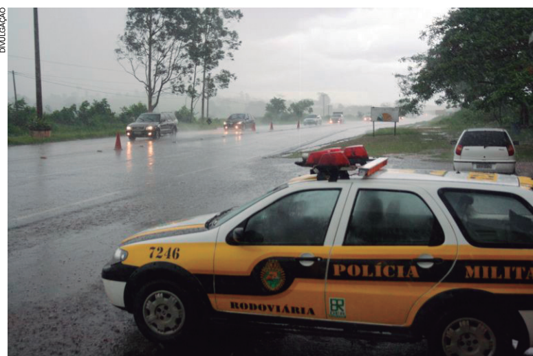
Mesmo com chuva em todo o Estado, Polícia Rodoviária intensifica fiscalizações no feriado prolongado