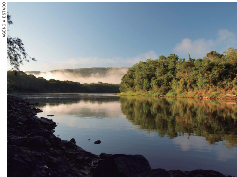
Microbacias contribuem para evitar o assoreamento dos rios