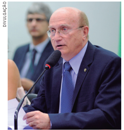
Dep. Osmar Serraglio, presidente da Frente Parlamentar do Cooperativismo

(OCB), as cooperativas de crédito, instituições financeiras sem fins lucrativos, reguladas e fiscalizadas pelo Banco Central do Brasil (BCB), reúnem mais de 9 milhões de cooperados, com ativos, em 2017, na ordem de R$ 220 bilhões, depósitos de R$ 103 bilhões e empréstimos de R$ 81 bilhões. O sistema está presente em aproximadamente 95% dos municípios, com mais de 5,5 mil pontos de atendimento.