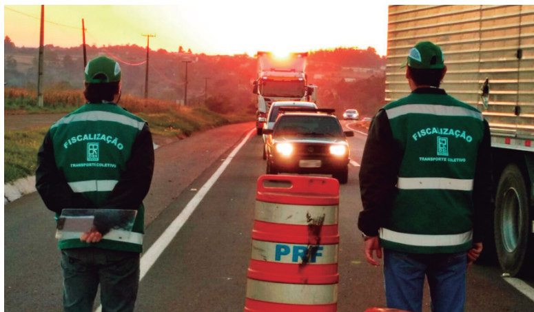
Fiscais do DER estarão nas rodovias

O Departamento de Estradas de Rodagem do Paraná (DER-PR) vai intensificar a fiscalização sobre o transporte coletivo rodoviário intermunicipal de passageiros durante a Operação Verão, que começa em 21 de dezembro. Todas as rodovias do litoral paranaense serão monito-