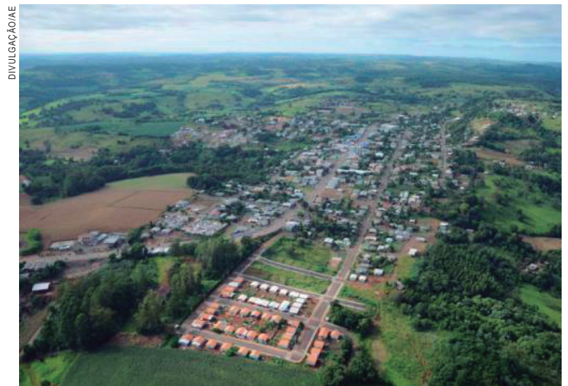
Cidade do interior com maior participação na economia estadual