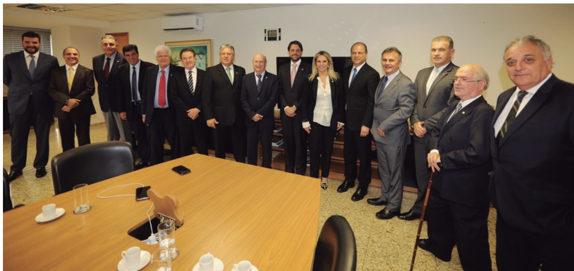
A governadora em exercício, Cida Borghetti, com deputados da Bancada Paranaense, em Brasília

A governadora em exercício Cida Borghetti articulou junto ao Governo Federal, com o apoio da bancada paranaense, a liberação de R$ 35 milhões do orçamento da União para investimentos na Saúde do Paraná. Os recursos foram confirmados pelo ministro da Saúde, Ricardo Barros, em reunião nesta quarta-feira (13) em Brasília.