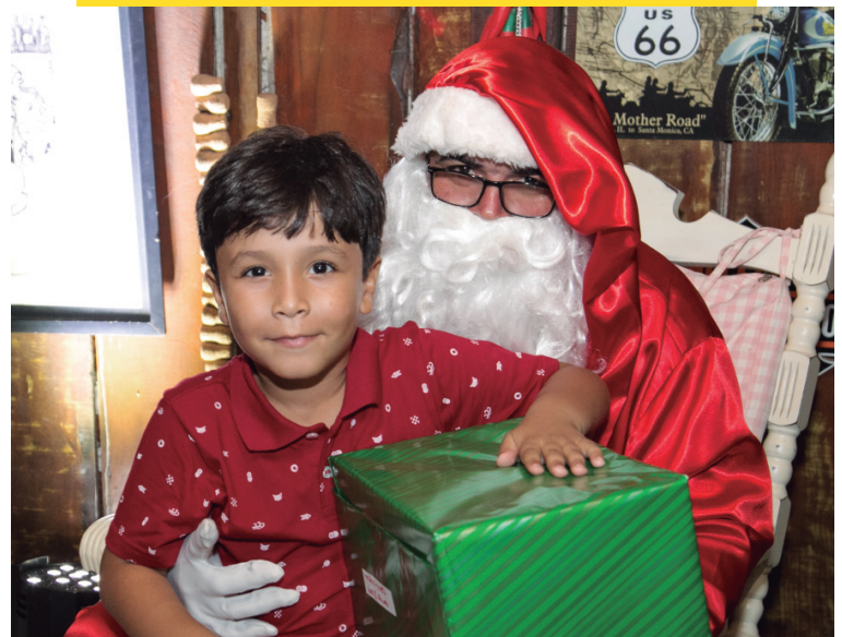
A noite também foi de emoção e presentes na noite do último sábado (9) na festa de confraternização dos funcionários da Uvel, com dose dupla de alegria festejando o Prêmio Classe A e a maravilhosa festa de fim de ano.