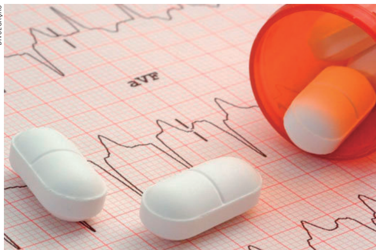
No total, foram 694 milhões de embalagens comercializadas, o que corresponde a 15,3% dos produtos distribuídos