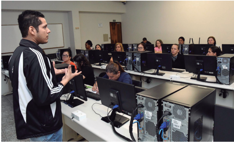
Agentes Comunitários de Saúde, em treinamento para acessar plataforma e-SUS

cativo do sistema, instalado nos tablets usados pelos agentes. Ao final do trabalho, as informações são registradas na plataforma e em determinados períodos são elaborados os relatórios. Pela manhã, os agentes serão reunidos das 9h às 11h30 e na parte da tarde das 14h30 às 17h. "A capacitação tem orientações teóricas e acesso prático, possibilitado graças à parce-