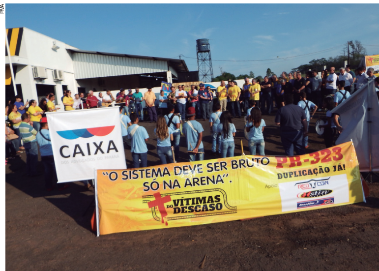
Além do culto ecumênico, a manifestação pela duplicação da PR 323

O Governo do Estado já anunciou que vai dar início à duplicação, estando previstas, as primeiras obras, na área urbana de Umuarama, no trecho entre o trevo do Gauchão e o trevo de Mariluz, além de um trecho entre Paçandú e Água Boa.