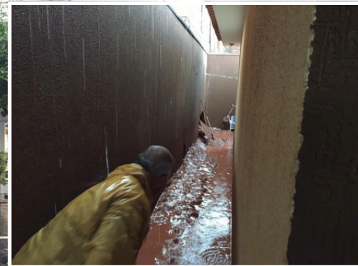
Árvore caída sobre o asfalto foi cortada por equipes da prefeitura e retirada. Casa foi invadida por lama no Parque Irani

Os vizinhos se acertaram quanto ao conserto do muro e agentes da Defesa Civil do Município foram acionados, para verificar se a estrutura do imóvel havia sido comprometida. A casa não chegou a ser interditada.