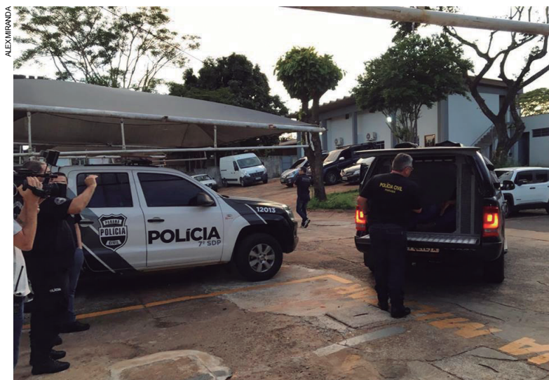
Policiais civis encaminham durante a manhã sete pessoas pedidas pela Justiça por não pagarem pensões alimentícias

O delegado chefe reforça que os pais que não pagaram suas dívidas e, depois de recolhidos não se ajustarem, permanecerão durante os feriados de Natal e Ano Novo atrás das grades. "Estes que não se regularizarem perante à Vara da Família permanecerão pelo período de 60 dias na cadeia, como pede a Justiça. Mesmo presos eles tem como efetuar os pagamentos e posteriormente serem liberados", encerra o delegado.