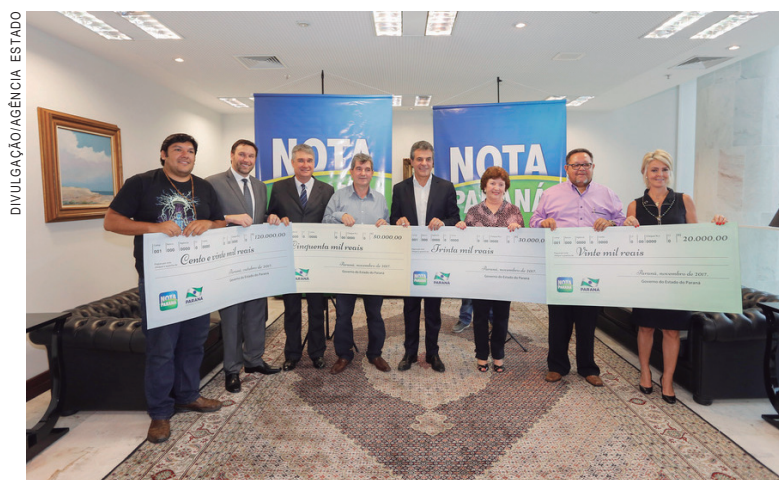
Apaes receberam os cheques do Nota Paraná

Inscrita no programa desde março do ano passado, a Apae de Arapongas já arrecadou mais de R$ 330 mil entre premiações e créditos do Nota Paraná. Os recursos têm sido essenciais para a manutenção do atendimento diário aos 380 alu-