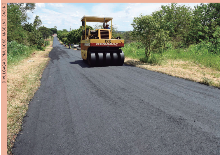
Recape também atende interior do município

Por meio da Secretaria Municipal de Obras, Planejamento Urbano e Projetos Técnicos, a Prefeitura de Umuarama vem estendendo o programa de recuperação da malha asfáltica com obras de recape e reperfilamento, tanto na zona urbana quanto em áreas da zona rural que contam com pavimento. É o caso da Estrada Juvenal, que corta a rodovia PR-323 e liga diversas propriedades rurais.