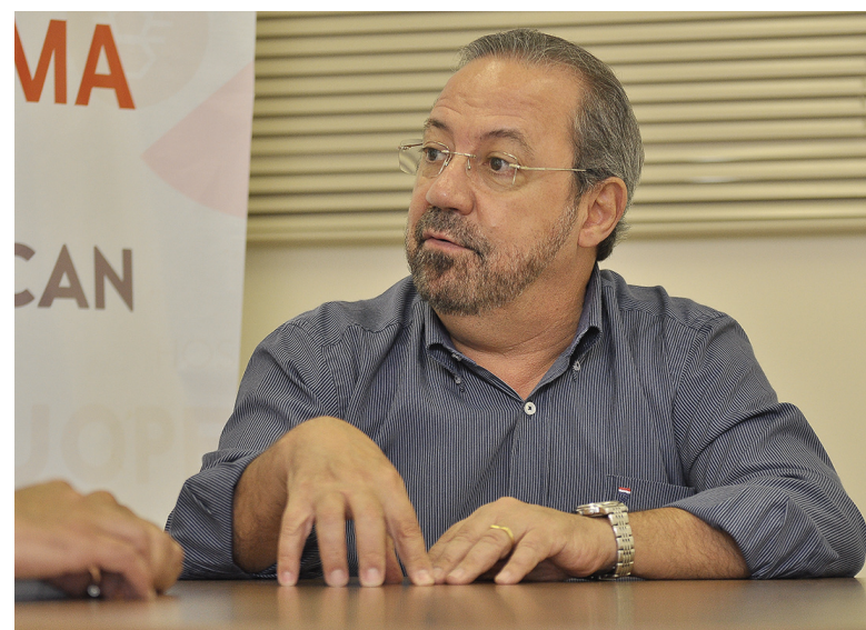
O diretor da Uopecan não pensa em parar agora