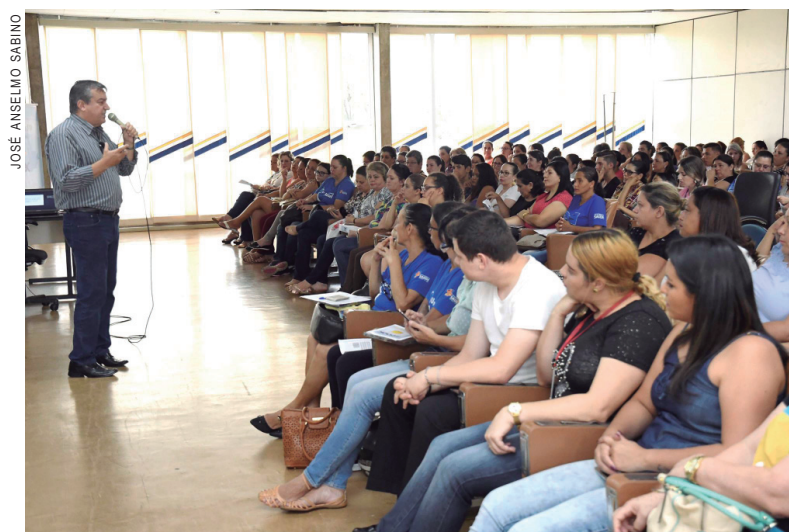
Servidores da Saúde, recebem treinamento sobre humanização no atendimento