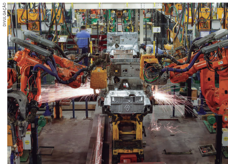
A indústria da transformação foi a que mais cresceu

De acordo com o IBGE, pela primeira vez desde a série iniciada em 2012, o PIB recuou em todas as unidades da federação. O Paraná sentiu menos os efeitos da crise e aumentou a participação na economia do País mas, assim como os demais Estados, sentiu os efeitos da recessão.