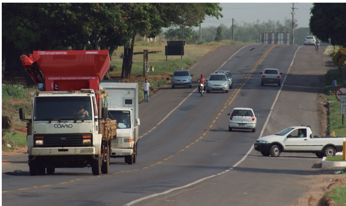
PR 323, corredor do transporte rodoviário justifica duplicação

A Comissão Pela Duplicação da Rodovia PR 323 está preparando para início do mês de dezembro um evento que pretende contar com a participação de toda a sociedade civil organizada do Noroeste do Paraná. A intenção é reforçar a importância da duplicação da rodovia PR 323, no trecho entre Paíçandu e Guaíra, e buscar a efetiva participação dos cidadãos nessa luta.