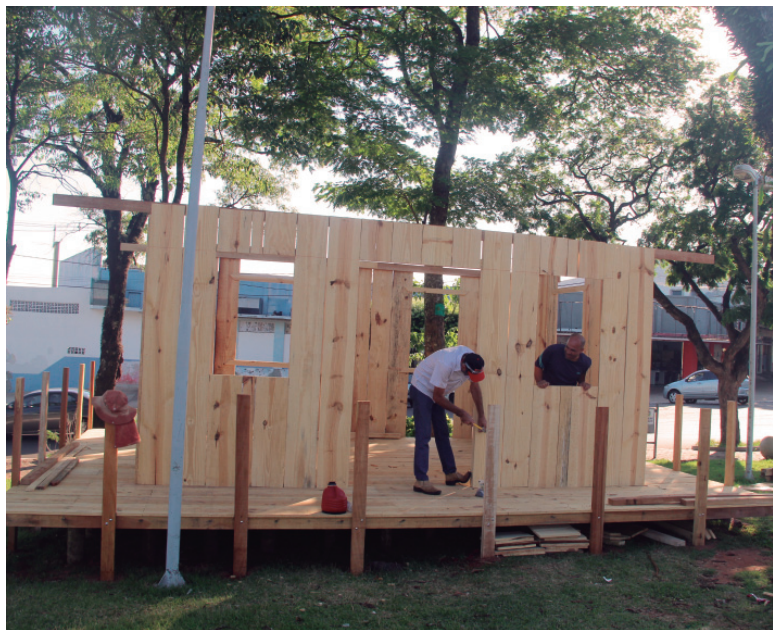
Funcionários da Prefeitura trabalham na construção da Casinha de Natal

A Prefeitura em parceria com a Associação Comercial Industrial Agrícola de Cruzeiro do Oeste (ACICO) lançará, no próximo mês, a campanha “Natal do Bem”. A ação será executada com intuito de aquecer a economia local e proporcionar lazer aos cidadãos.