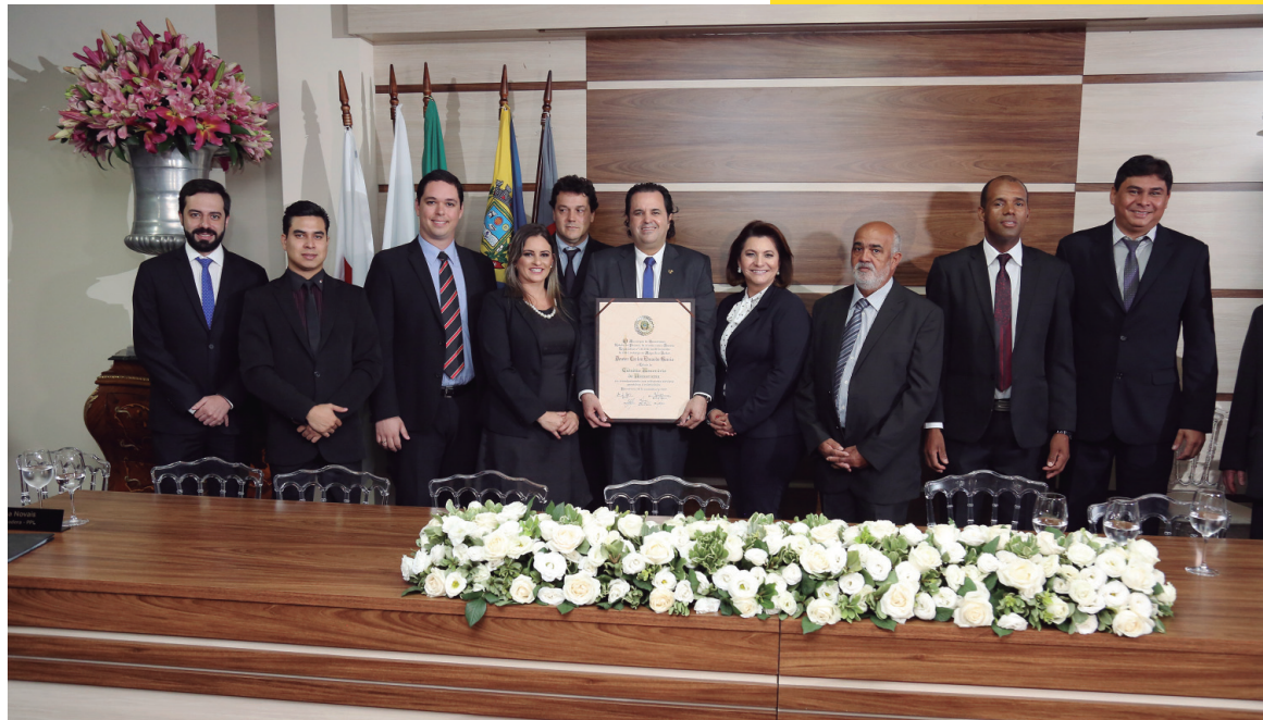
Reitor e os vereadores: aprovação unânime do nome para a honraria maior do município