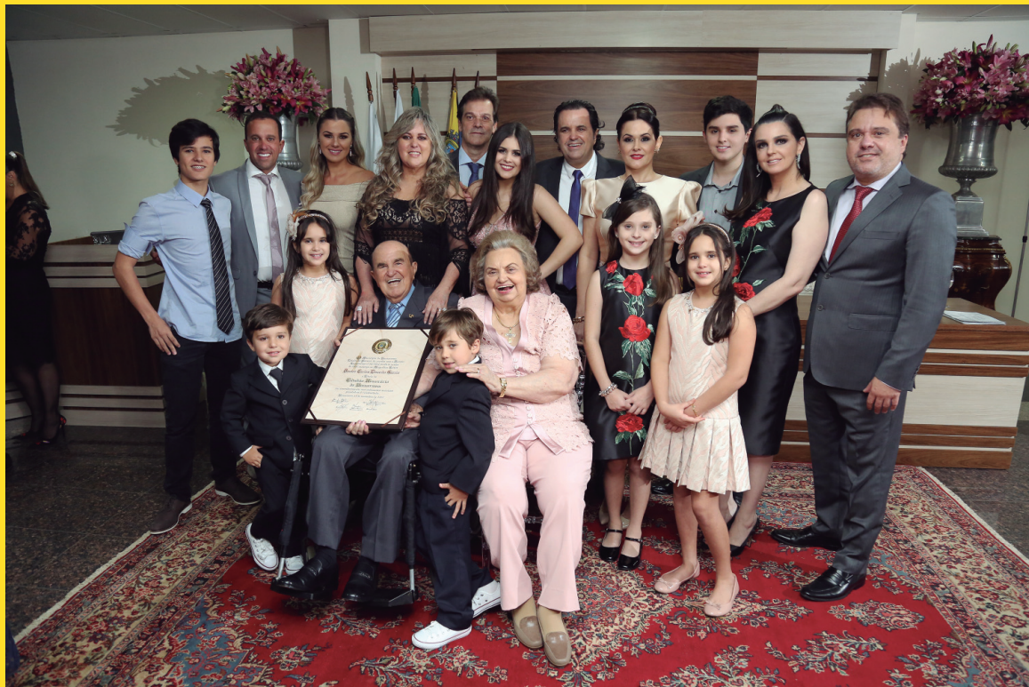
Reitor e a família: dedicação e carinho pelos pais, irmãos, cunhados, filhos e sobrinhos

A Coluna marcou presença juntamente com a equipe do jornal Tribuna Hoje. município