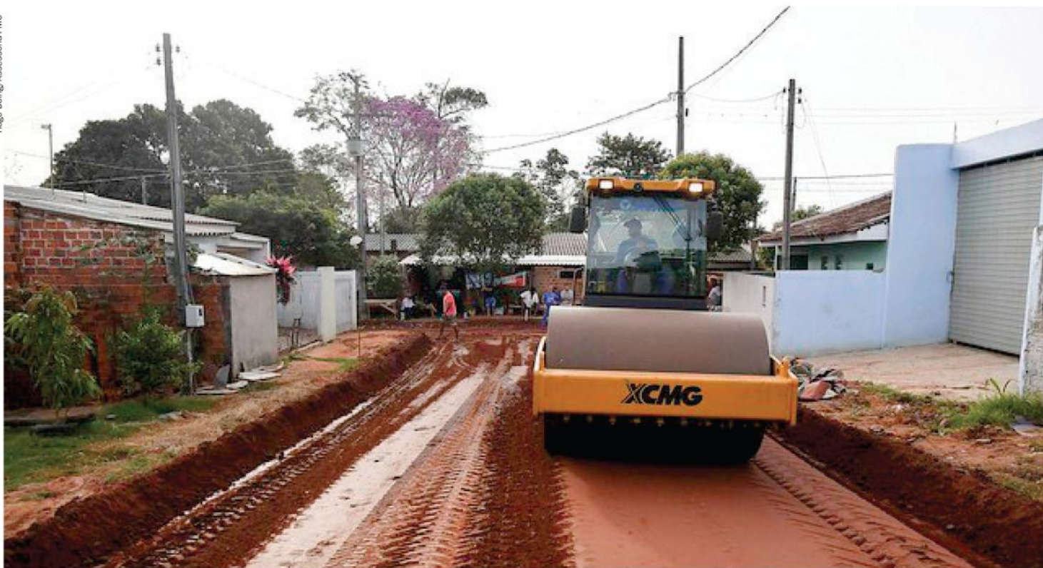
PARTE do recurso será utilizado em pavimentação asfáltica e na infraestrutura do município

Na sessão ocorrida (terça-feira) foram apreciados os projetos que dão diretrizes a utilização dos recursos e ambos foram aprovados, apesar dos três votos contrários recebidos.