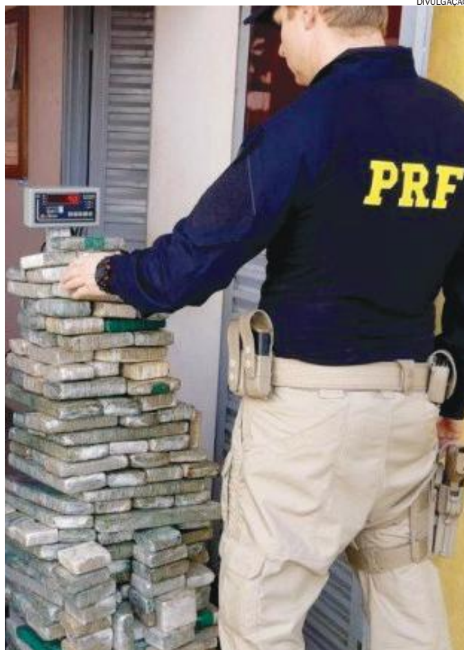
DROGA apreendida vinha de Arau Moreira/MS e tinha como destino Umuarama