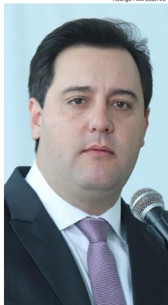
Rodrigo Félix Leal/ANPr

(Envie sua opinião com até 1.200 caracteres para editoria@jhoje.com.br)