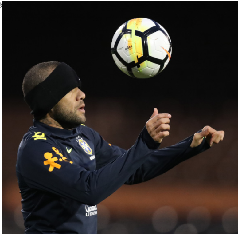
Daniel Alves será o capitão do Brasil contra a Inglaterra

A seleção brasileira volta a ter força máxima para enfrentar a Inglaterra em partida amistosa nesta terça-feira, às 18h (de Brasília), no Estádio Wembley, localizado em Londres. Para o duelo, o técnico Tite colocará em campo, pela primeira vez desde que assumiu o cargo de treinador, a equipe que considera a ideal, formada por: Alisson; Daniel Alves, Marquinhos, Miranda e Marcelo; Casemiro; Paulinho, Renato Augusto, Coutinho e Neymar; Gabriel Jesus.