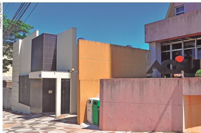
Prédio ao lado da Aciu deve abrigar a Casa do Empreendedor

Por meio da Secretaria Municipal de Educação, a Prefeitura de Umuarama mantém há alguns anos um projeto em conjunto com o Sebrae, o programa Jovens Empreendedores Primeiros Passos (JEPP), que objetiva a aplicação da metodologia nas escolas da rede pública, envolvendo professores e alunos do Ensino Fundamental I (séries iniciais). "O projeto busca disseminar a