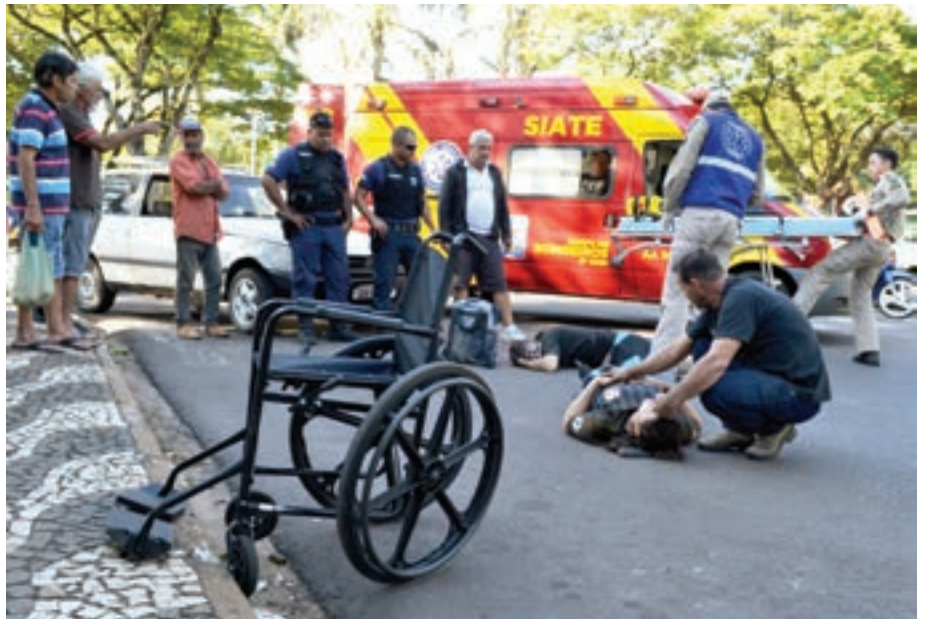
VEÍCULO atropelador ficou sobre a faixa de pedestre enquanto vítimas eram socorridas

Outros pedestres assistiram o acidente e relataram que o Fiat uno fazia o contorno da praça e entraria