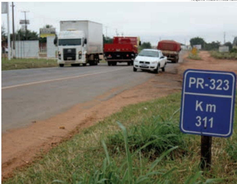
É o primeiro processo na operação envolvendo desvios no governo do Paraná com instrução encerrada