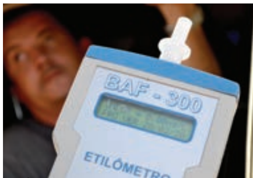
BAFOMETRO apontou que condutor não estava embriagado

De acordo com o policial militar que atendeu ao acidente, o Fiat Uno foi recolhido ao pátio do 25º BPM, pois realmente apresentava irregularidades na documentação e por estar sendo conduzido por uma pessoa que não possuía Carteira Nacional de Habilitação (CNH). O condutor foi ouvido em Termo Circunstanciado e depois liberado.