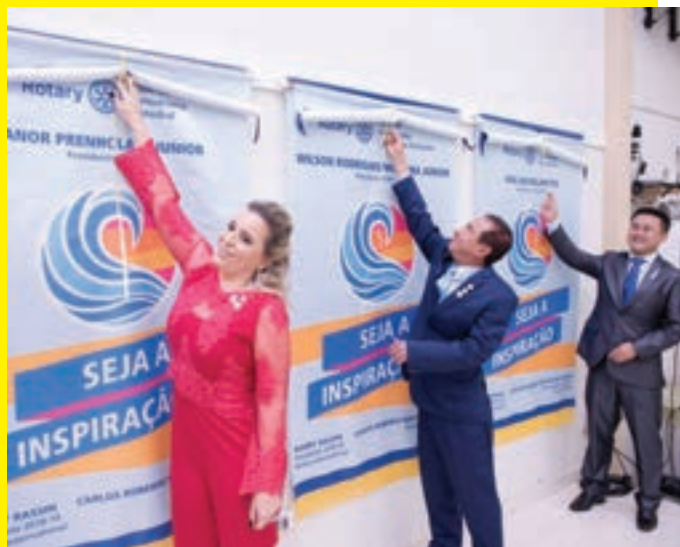
Descerra o banner do RC