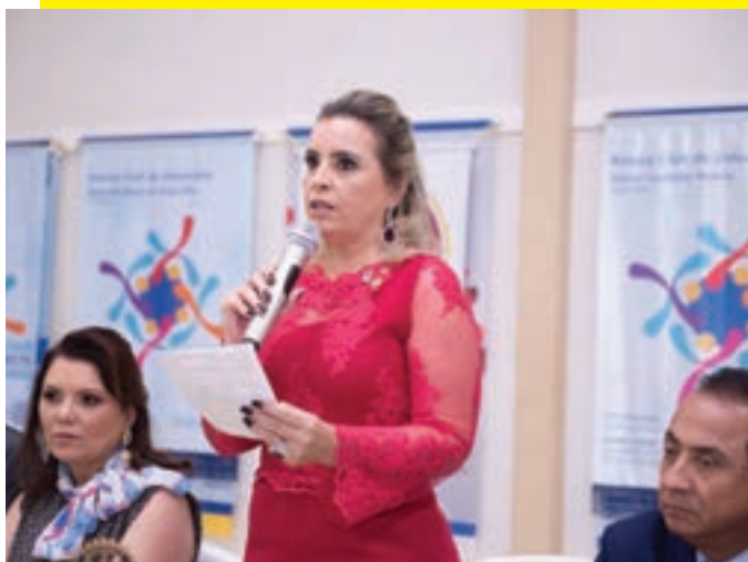
Discursa aos presentes ...