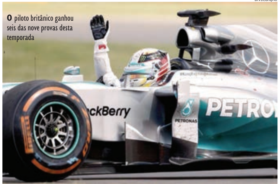
O piloto britânico ganhou seis das nove provas desta temporada

“Suspeito que neste fim de semana a briga será mais apertada entre todos nós. No ano passado, a Ferrari foi super rápida aqui (Silverstone) também, assim como as Red Bull. Então definitivamente não será um fim de semana fácil, mas