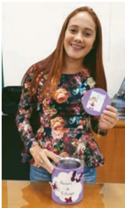
Estudantes de Pedagogia apresentam a “sua lata”: produção com embasamento científico e intenção de ensinar a criança a se comunicar melhor