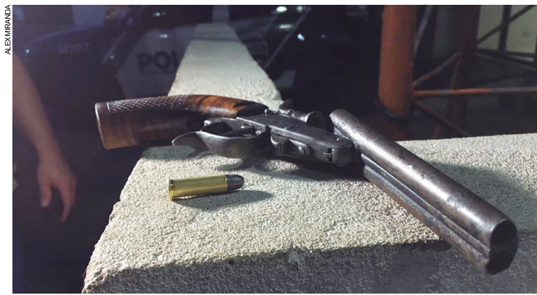
Arma abandonada por um dos assaltantes foi recolhida e entregue à Polícia Militar por um dos moradores

Minutos antes das 18h, numa das chácaras situada na Estrada Pavão, saída para Xambê, o caso aconteceu. Um dos proprietários estava consertando o telhado de sua casa quando notou a aproximação de um jovem suspeito. Rapidamente ele se apossou de uma pistola de calibre 380 e procurou pelos suspeitos, ocasião em que se deparou com a 'gangue' toda. Um deles armado com uma espingarda de grosso calibre chegou a apontar a arma, mas não puxou o gatilho. Depois de deflagrar um disparo com sua pistola, o morador viu os criminosos fugindo à pé, abandonando uma garrucha de dois canos, calibre 38 municiada com um cartucho intacto, além