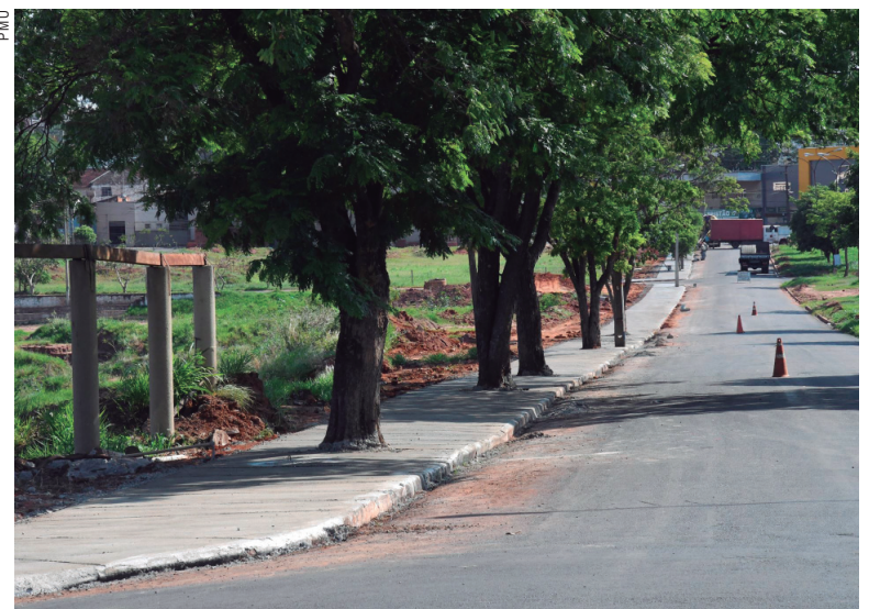
A restauração foi feita com recursos da pavimentação da Avenida