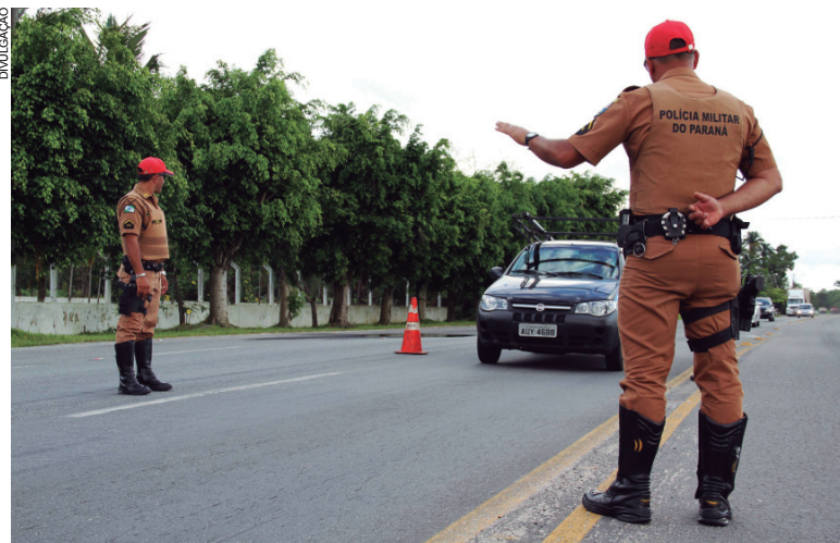
Além do efetivo das seis companhias do Batalhão da PRE, a operação conta com policiais do serviço administrativo

outras atitudes perigosas como a ultrapassagem em local proibido