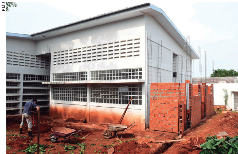
A obra vai aumentar em 148,7 metros quadrados a área útil do posto de saúde e custará R$ 231,6 mil