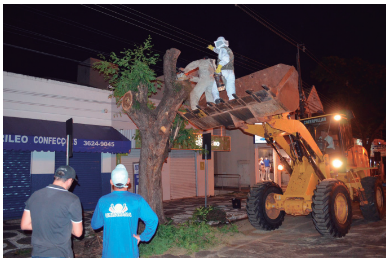
Dois árvores foram cortadas por estarem comprometidas e com risco de queda, uma delas apresentava uma colmeia de abelhas

Após avaliação técnica do setor de Animais Sinantrópicos, Venenosos e Peçonhentos (ASVP) da Coordenadoria de Vigilância em Saúde (Covisa), duas árvores foram retiradas nesta semana da calçada da Avenida Paraná, próximo ao cruzamento com a rua Governador Ney Braga. Além de estarem comprometidas e com risco de queda, uma delas apresentava uma enorme colmeia de abelhas do gênero Apis mellifera , que representam risco de saúde em caso