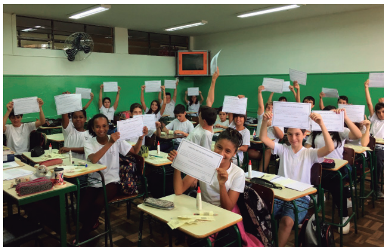
O projeto uniu alunos, servidores e a população em uma ação de engajamento social

essa formação e se envolveram em diversas atividades sobre o tema, como exposições artísticas, peças de teatro, confecção de urnas e objetos de arte fabricados com cupons fiscais recolhidos no comércio, trabalhos de conscientização com a comunidade, etc. "Desenvolver conteúdo de educação fiscal é muito mais do que trabalhar a cidadania. Você trabalha humanização", diz a professora Deo-