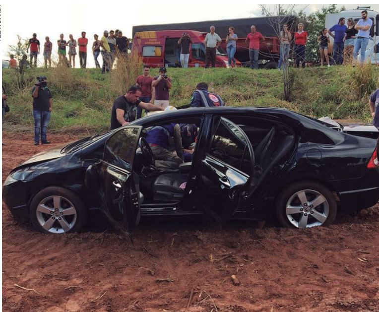
A passageira do Honda Civic sofreu ferimentos e foi socorrida pelo Samu e por bombeiros de Umuarama

A colisão que envolveu um Fiat Uno e um caminhão aconteceu no trecho compreendido entre Cruzeiro do Oeste e Tapejara. Tratou-se de uma colisão frontal e, por volta das 16h30 e um helicóptero do Samu foi deslocado para atender as duas vítimas, que estavam no Fiat Uno. Uma delas ficou presa às ferragens do carro. O caminhão, propriedade da usina Usaçucar, que esteve envolvido na colisão,