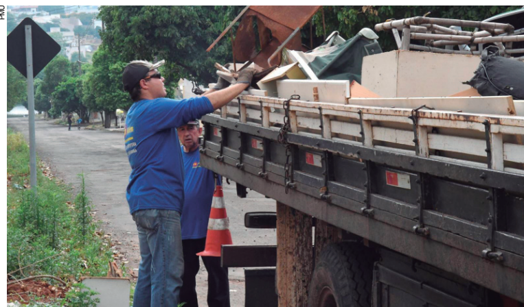
Os resíduos serão recolhidos das 7h às 11h por caminhões da Prefeitura e de uma empresa terceirizada