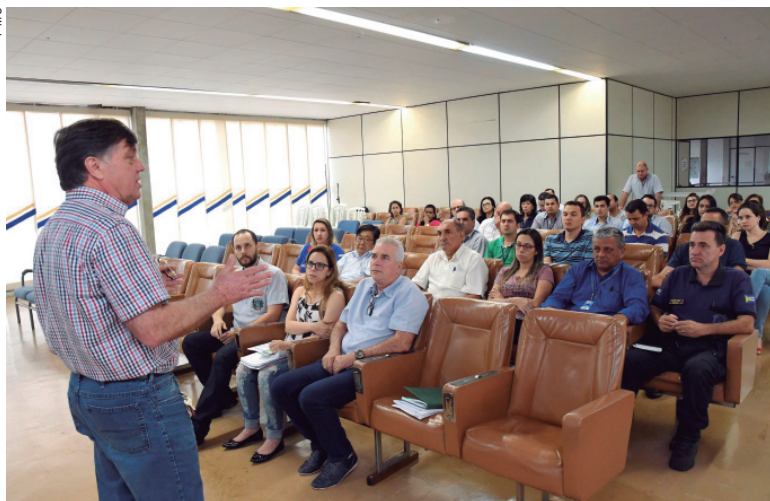
O projeto da Lei Orçamentária Anual foi apresentado ontem, em audiência pública, no auditório da Prefeitura

Com a confirmação das receitas e outros recursos de emendas parlamentares, tanto federais quanto estaduais, Pozzobom prevê investimentos nas áreas mais carentes e sensíveis, como infraestrutura urbana, educação, saúde, assistência social e agricultura e meio ambiente, entre outras. "Estamos reequipando nossa frota com a aquisição de máquinas e veículos novos, um investimento para os próximos anos que não precisará ser repetido. A partir de 2018, as receitas poderão ser aplicadas em obras públicas, pavimentação, equipamentos para os postos de saúde e escolas e