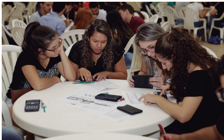
Estudantes respondem questões de conhecimento sobre a profissão

Em clima de descontração e também concentração, estudantes das quatro séries do curso de Ciências Contábeis parti-