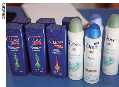
Produtos apreendidos com moradora de rua que os escondia numa bolsa ao praticar o furto

Dentro da bolsa estavam seis embalagens de xampu e quatro de desodorante.