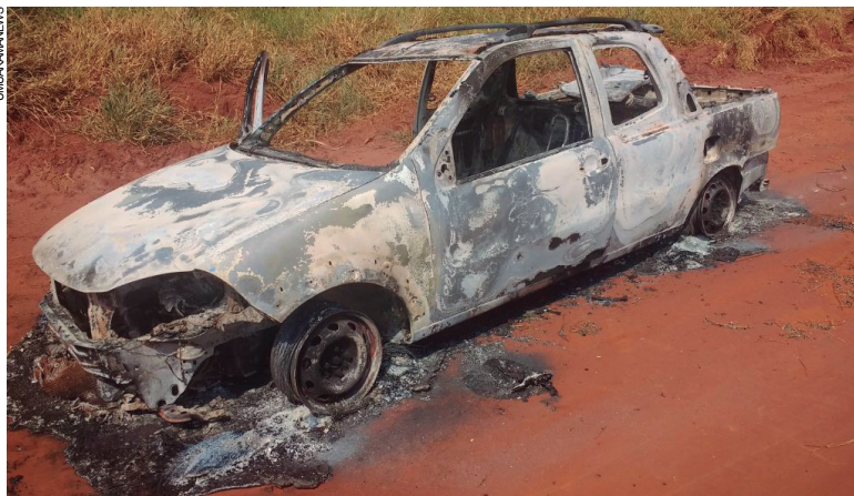
Veículo carbonizado onde estavam os corpos dos dois suspeitos da morte do policial do BPFron

volta das 2h, na Estrada Mestre, na comunidade conhecida como Jardim Paredão. A equipe já se preparava para retornar à Guaíra quando aconteceu o ataque.