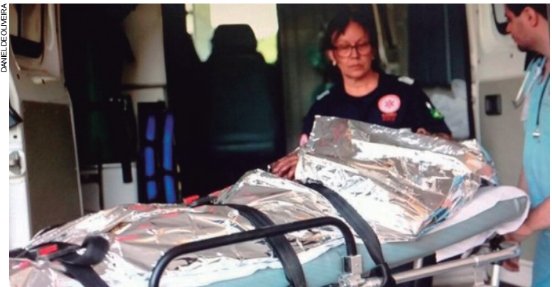
Vítima de atentado no Jardim Panorama foi socorrido e levado ao hospital de plantão em Umuarama

Durante o socorro, ele foi abordado e questionado pelos policiais, mas não quis informar o que havia acontecido, nem quem teria sido o autor da tentativa de homicídio, mas apresentava-se bastante alterado no momento do atendimento. O caso foi repassado aos cuidados da Polícia Civil, que tomou a frente das investigações.