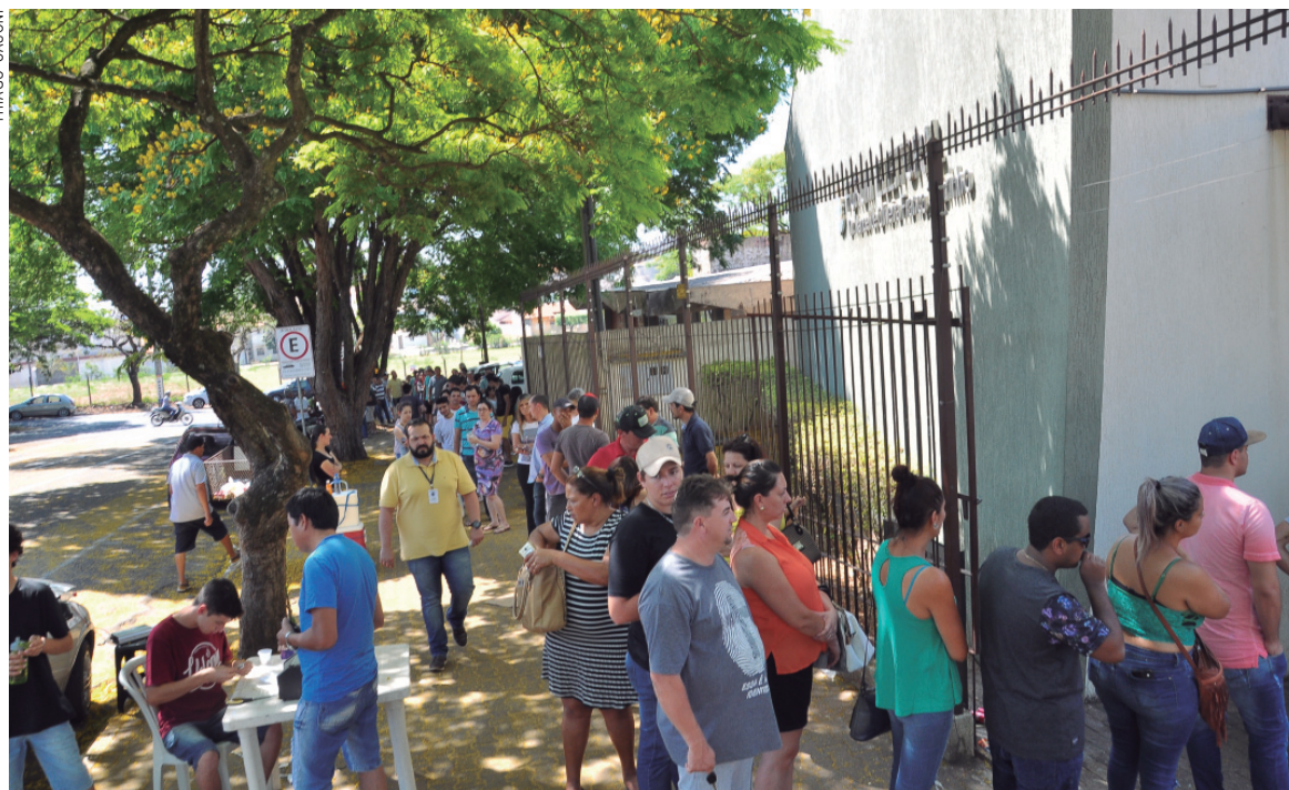
Centenas de eleitores precisaram aguardar na fila para fazer a atualização

Segundo os levantamentos feitos até às 15h de ontem (21), haviam sido feitas 61.374 revisões de títulos, ainda restavam cerca de 16 mil eleitores sem