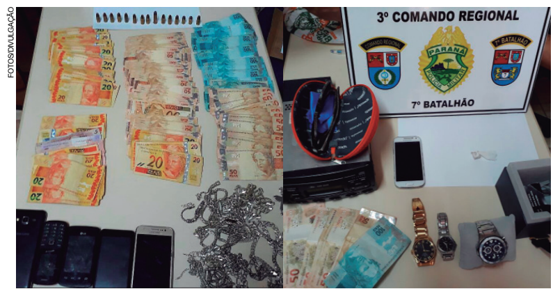
Dinheiro e parte dos objetos apreendidos durante a ação que contou com mais de 108 policiais civis e militares

Ao total, as equipes policiais que utilizaram 30 viaturas e um helicóptero, cumpriram 25 mandados de busca e apreensão que terminaram no encaminhamento de 13 pessoas, além de nove que foram presas em flagrante e na apreensão de um revólver de calibre 32; 14 munições de calibre 9 milímetros; uma munição de calibre 38; 153,6 gramas de maconha; duas gramas crack; na quantia de R$ 11.284 em espécie; 20 telefones celulares, diversas joias entre outros objetos.