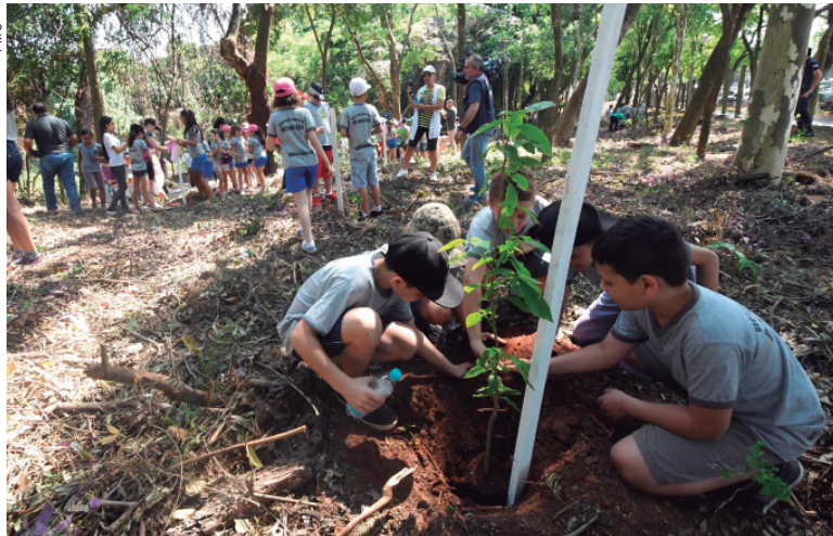
Alunos da rede municipal participaram da atividade

cuidar do meio ambiente e a recuperar as áreas degradadas", defendeu o prefeito.