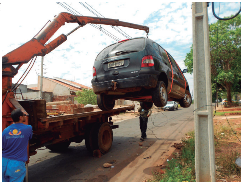
Uma perua VW Kombi foi um dos veículos recolhido na ação de fiscalização

dos um Ford Fiesta, um VW Santana, um Renault Scenic, um VW Fusca e uma perua VW Kombi, em diversos pontos da cidade. A ação reúne fiscais da Vigilância Sanitária e a Guarda Municipal, com base na Lei Complementar 362/2013. Os carros recebem a notificação com prazo de 15 dias para regularização, do contrário é aplicada multa (em torno de R$ 1 mil) e o veículo é transportado até o pátio da Prefeitura.