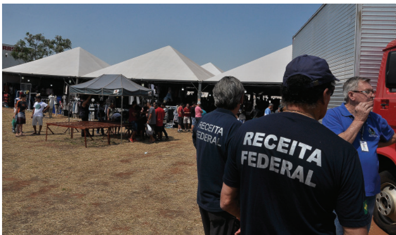
Fiscais da Receita Federal estiveram no local nesta quarta