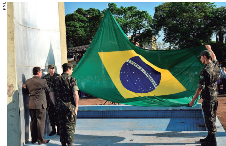
Desde o dia 1º, o hasteamento do Pavilhão Nacional vem acontecendo no período da manhã

o hasteamento do Pavilhão Nacional, organizado pela Secretaria Municipal de Educação, aconteceu durante as manhãs da Semana da Pátria com a presença dos alunos, em uma demonstração de civismo e amor à Pátria. "A equipe da Secretaria de Educação está de parabéns pela iniciativa e as entidades, empresas e organismos da sociedade organizada também, por participarem ativamente deste momento", acrescentou o prefeito. A comunidade também está convidada para o arriamento da