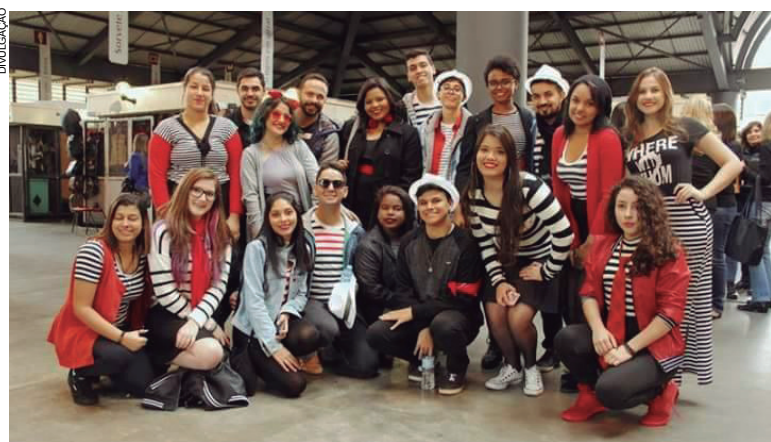
Fundado em 2012, Coro Cênico possui atualmente 24 integrantes

Nesta trajetória de produções, O Coro Cênico Cia Schubert passou a participar de festivais de música em diversas localidades. A partir de 2016 vem se apresentando Festival Inter-