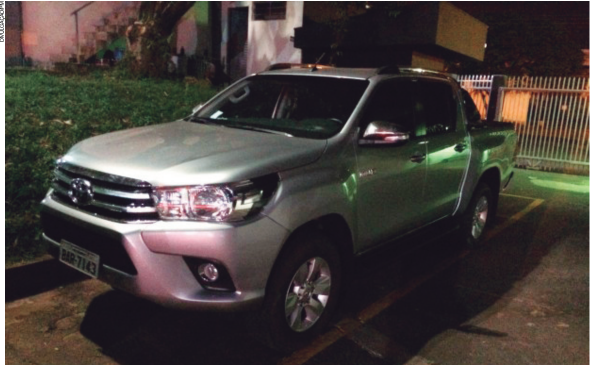
Veículo roubado em Cianorte após assalto foi encontrado em Umuarama

Simultaneamente, equipes da 5ª Companhia Independente de Polícia Militar (5ª CIPM) foram até a residência das vítimas e as encontraram amarradas, as quais receberam o atendimento de emergência no local. Diante da situação os envolvidos foram presos e a situação repassada à Polícia Civil para dar prosseguimento no caso.