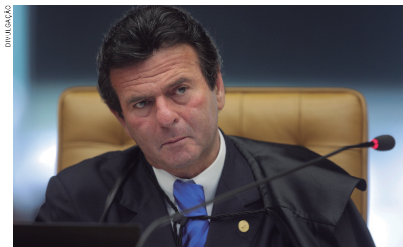
Luiz Fux, ministro do STF

decano na Corte, também fez um desagravo à presidente do Supremo, Cármen Lúcia, que determinou terça-feira que a Polícia Federal investigue citações indevidas a ministro do tribunal nas conversas dos delatores. "As graves insinuações que transparecem dos diálogos mantidos por determinados agentes colaboradores, mostram-se, tais insinuações, impregnadas de elementos que, se não forem cabalmente esclarecidos, culminarão por injustamente expor esta Corte e os magistrados que ela integram ao juízo severo, ao juízo inapelável da própria cidadania", disse Mello.