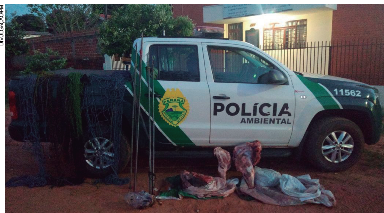
Após denúncia, carne e couro de capivara apreendidos em residência

Foi lavrado um termo circunstanciado e o infrator deverá responder pelo artigo 29 da